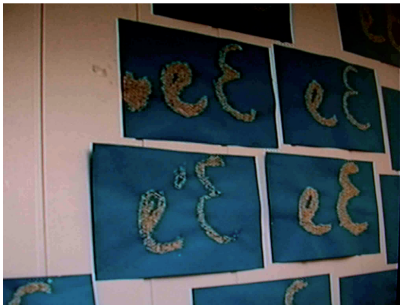
Fot. 2. Piaskowe litery

2. Wczesna nauka pisania i czytania. Zainteresowanie dziecka nauką czytania i pisania zaczyna się już w przedszkolu, dlatego też twórczyni metody opracowała pomoce, które pomagają przedszkolakom. Są to odpowiednio pomoce, w tym metalowe figury czy pisakowe litery (por. fot. 2). Na początkowym etapie nauki figury wycięte z metalu pozwalają uczniom kształcić motorykę, naśladować (poprzez obrysowywanie figur) kreślenie znaków literopodobnych, linii pionowych i poziomych. Piaskowy alfabet (litery, które zostały zapisane za pomocą piasku) pomagają dzieciom łączyć ruch z pisaniem (sprawność grafomotoryczna). Dzieci „śledzą” palcem wygląd danej litery, a następnie starają się ją zapisać. Dzięki tym prostym pomocom i otaczającym uczniów literom i wyrazom (por. fot. 3) dzieci szybko uczą się pisania prostych wyrazów już w przedszkolu, doskonałą tę umiejętność w zerówce i klasach I—III. Po opanowaniu zapisu uczniowie uczą się czytania (w tym: prostych wyrazów już w przedszkolu) zarówno na poziomie semantycznym (powinien być opanowany do końca nauki w klasie III), jak i krytycznym czy twórczym (umiejętność ćwiczona długoterminowo na wszystkich etapach nauki).