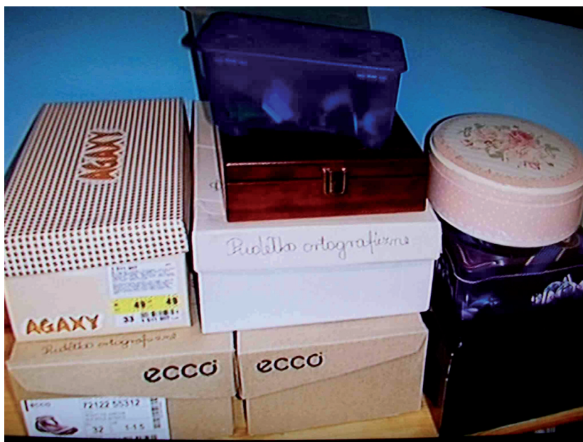
Fot. 4. Pudełko ortograficzne

4. Kącik czytelniczy. W każdej klasie Montessori znajduje się zawsze kącik czytelniczy. Książki są zróżnicowane: od infantylnych, prostych dziecięcych historyjek, komiksów, krótkich bajek, baśni, lektur, po książki z różnych dziedzin wiedzy, w tym encyklopedie, poradniki, słowniki, literatura fachowa. Dzieci pracujące systemem Montessori na lekcji z rozwijania zainteresowań mają 15 minut na swobodne czytanie. Mogą wybrać dowolną książkę (gong obwieszcza początek i koniec czasu). Po zakończeniu czytania zadaniem uczniów jest udzielenie odpowiedzi na pytanie, którą książkę wybrali i czego się dowiedzieli. Tego typu ćwiczenie ma zatem wiele zalet: z jednej strony rozwija aktywność czytelniczą uczniów, z drugiej — kształci umiejętność słuchania, przestrzegania odpowiednich zasad, kształci kompetencję komunikacyjną oraz czytanie ze zrozumieniem (tutaj dodatkowo dzieci mają odpowiednią motywację do pracy, wiedzą, że będą musiały opowiedzieć treść przeczytanego fragmentu).