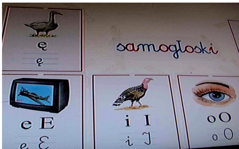
Fot. 3. Samogłoski

3. Nauka ortografii. Niestety, w pracach Marii Montessori nie ma dokładnych wskazówek związanych z konstruowaniem pomocy ortograficznych. Poszczególne szkoły pracujące jej metodą znalazły swoje praktyczne rozwiązania. Jedną z propozycji jest „skrzynka do nauki wyrazów” 15 . Skrzynka ma kształt podłużnego pudełka z pięcioma przegródkami, służy do przechowywania słów. Nauczyciel przygotowuje zestaw słów do nauki (np. 10 wyrazów z daną trudnością ortograficzną na dany tydzień) 16 . Pomocne stają się również pudełka ortograficzne (por. fot. 4). Każdy uczeń przynosi pudełko, do którego będzie wkładał wyrazy, których pisownia sprawia mu trudność (mogą to być ortogramy zapisane na kartce, jak również rysunki przedmiotów, których dziecko nie potrafi poprawnie zapisać). Ważne jest, aby tego typu środek dydaktyczny wykorzystywać regularnie 17 .