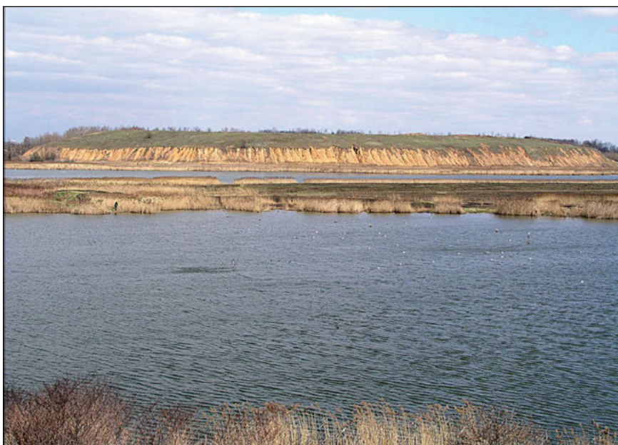
Fot. 2. Hałda osadów poflotacyjnych w Zespole Przyrodniczo-Krajobrazowym „Żabie Doły”

Phot. 1. Forest catchment of reservoir No 9 located in Zabrze