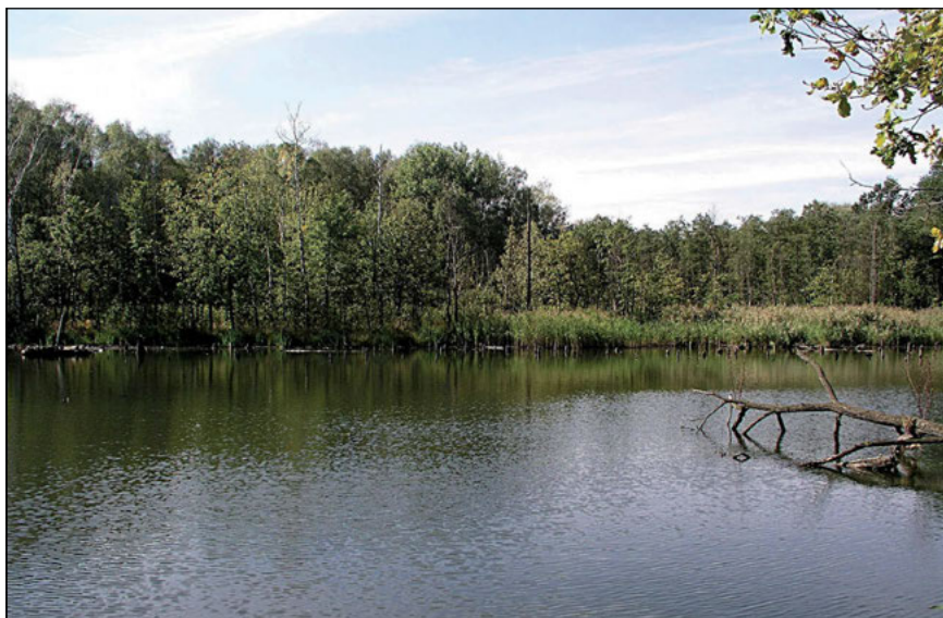
Fot. 1. Leśna zlewnia zbiornika nr 9 położonego w Zabrze

Phot. 1. Forest catchment of reservoir No 9 located in Zabrze