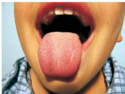
Zdj. 5. Próba piąta

Ostatnia próba to wysuwanie języka na brodę (zdjęcie 5). Kształt języka może świadczyć o ankyloglosji – jest lekko sercowy, z nieco krótszą prawą stroną. W tym wypadku nie ma żadnych ruchów współtowarzyszących.