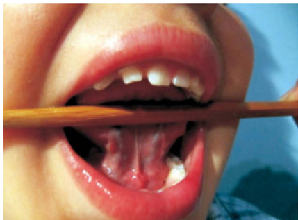
Zdj. 2. Próba druga

Druga próba przeprowadzana jest w ten sposób, że przednią część języka przyciska się szpatułką do powierzchni podniebienia za górnymi zębami. Powstaje w ten sposób tzw. kobra, która wygląda mniej więcej tak, jak przedstawia to zdjęcie 2. W tym przypadku język jest szeroki, apeks