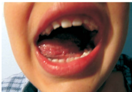
Zdj. 4. Próba czwarta

Próba czwarta polega na dotykaniu czubkiem języka ostatnich tylnych zębów. Jak widać na zdjęciu 4, język wypełnia dużą przestrzeń w jamie ustnej. Część podjęzykowa jest widoczna wraz z wędzidełkiem. Symetryczność zachowana. Nie ma ruchów towarzyszących. To ćwiczenie potwierdza wcześniejszą tezę o ograniczonej sprawności powiązanej z ograniczoną ruchliwością.