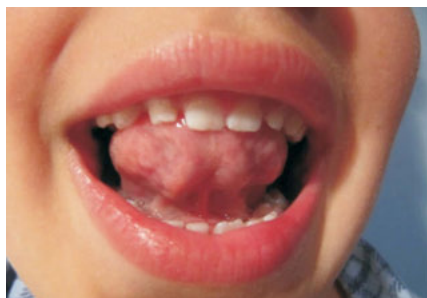
Zdj. 1. Próba pierwsza

Pierwsza próba polega na unoszeniu szerokiego języka za górne zęby przy opuszczonej żuchwie. Chłopiec wykonał to zadanie w sposób, jaki pokazuje zdjęcie 1. Jak na nim widać, język jest szeroki, u podstawy wydaje się węższy niż w apeskie. Widoczne jest napięcie całego mięśnia