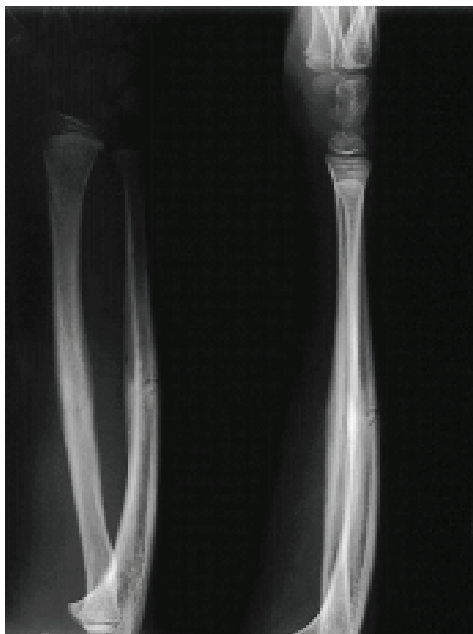
Slika 3. Rendgenske slike saniranog prijeloma u bolesnika čije su preoperativne i rane postoperativne slike prikazane na slici 2. Figure 3 X-ray pictures of the healed fractures in patients whose preoperative and early postoperative pictures are shown in Figure 2

Prvih poslijeoperacijskih dana započeto je opterećenje ili uporaba ozlijeđenog ekstremiteta tako da nije bilo potrebno nikakvo fizijatrijsko liječenje. Sav potrebn postupak fizijatra s ovim bolesnicima sastojao se u tome da im se pokaže uporaba potpazušnih ili podlaktičnih štaka u početku uporabe ozlijeđenoga donjeg ekstremiteta, kako bi se bolesnik ohrabrio i bez straha se služio nogom i oslanjao se na nju. Jedan se naš bolesnik odmah nakon izlaska iz bolnice, tj. četvrtog dana nakon osteosinteze radiusa i ulne, počeo potpuno slobodno služiti ozlijeđenom rukom u pisanju školske zadaće. Rendgenske slike učinjene nakon prijeloma i odmah nakon uvođenja Prévot-Nancyjeva čavla prikazuje slika 2., a slika 3. prikazuje rendgenske slike konsolidiranih prijeloma dvojice naših bolesnika, učinjene neposredno prije uklanjanja čavala, a u jednog odmah nakon uklanjanja. Vidi se idealan položaj sraslih ulomaka, tj. idealna anatomska restitucija prelomljene kosti.