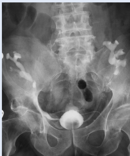
Slika 1. Snimka na zaštitnu protezicu koja pokazuje urednu ureterovezikalnu anastomozu obostrano. Figure 1. Good ureterovesical anastomosis (bilaterally) showed by radiography on ureteral prosthesis.

hemoglobina bolesnik je poslijeoperacijski dobio dvije doze filtriranih eritrocita. Transplantirani bubrezi svakodnevno su ultrazvučno kontrolirani, a na sam dan otpusta indeks otpora bio je 0,74 u desnom bubregu, a 0,72 u lijevom bubregu, bez kolekcije oko bubrega i bez hidronefroze (slika 2). Također je učinjena i scintigrafija bubrega (MAG-3), pri čemu se vidjela nešto slabija perfuzija obaju presađaka uz normalnu drenažu (slika 3). Tijekom boravka provedena je standardna imunosupresivna terapija (takrolimus, metilprednizolon, mikofenolat mofetil). Bolesnik je dobio u