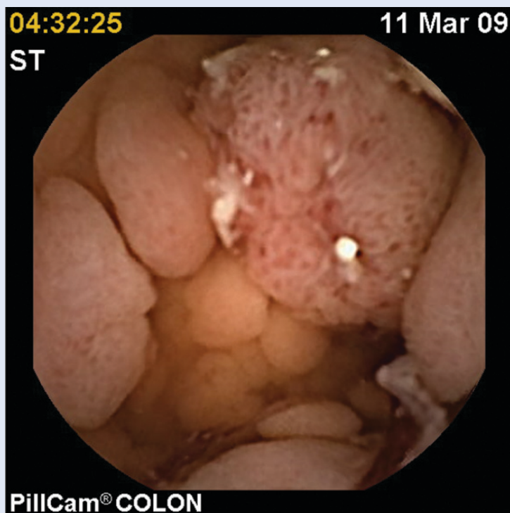
Slika 3. Multipli polipi kolona – familijarna adenomatозна polipoza – FAP Figure 3. Multiple colon polyps – Familial adenomatous polyposis – FAP