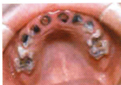
Slika 3. Ekspozirana zubna pulpa Figure 3 Exposed dental pulp