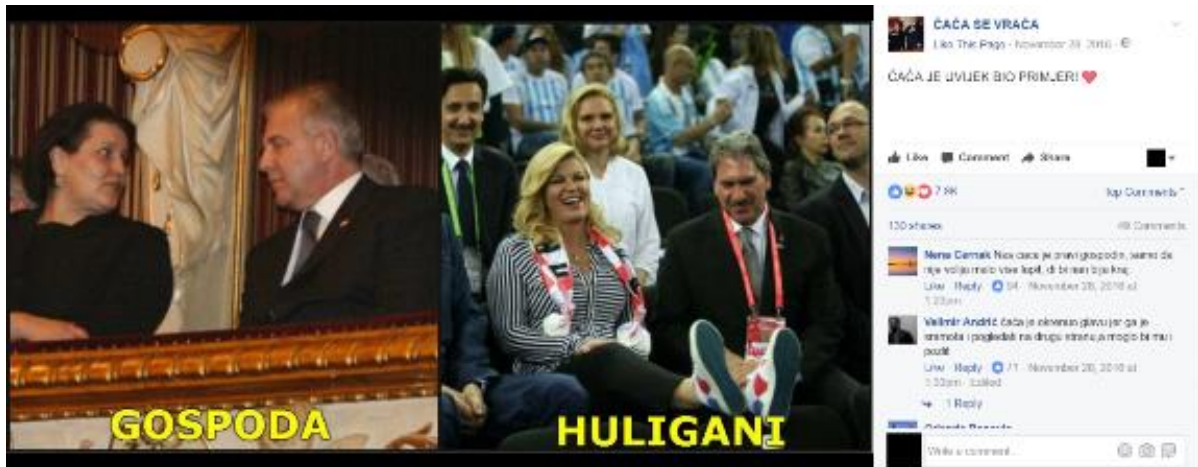
Primjer 2- ČAČA i "Kolinda huligan"

dominantni medijski diskurs koji je nerijetko isticao upravo Sanaderov kulturni kapital kao njegovu političku prednost i specifičnost, te se na taj način ironizira i indirektno, satirički kritizira „manjak“ kulturnog kapitala Kolinde huligana/predsjednice Grabar Kitarović.