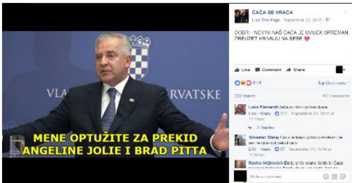
Primjer 5a – ČAČA i prekid Jolie-Pitt

Primjer 5a prikazuje ČAČU kako reagira na medijsku spektakularizaciju rastave braka holivudskih filmskih zvijezda Angeline Jolie i Brada Pitta, kada se u mnogim tabloidnim, kao i informativnim emisijama, senzacionalistički pratio rasplet njihova odnosa, dok je jedno od glavnih pitanja bilo – tko je kriv za prekid? ČAČA ponovno istupa, spreman preuzeti krivicu za njihov prekid.