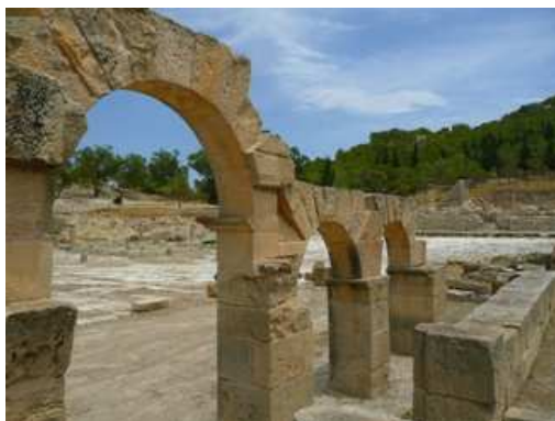
Nimfeu de Pheradi Majus (Sidi Khélifa), un dels jaciments de Tunísia estudiats.