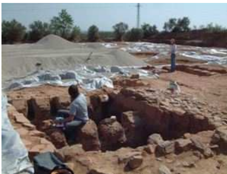
Figura 2. Presa de mostres al Vila-sec (Alt Camp) just abans que torni a ser colgat sota la nova carretera.

La datació arqueomagnètica d'un jaciment arqueològic requereix el coneixement previ de les variacions del camp magnètic terrestre a la zona del jaciment. Aquestes variacions es poden conèixer a partir de la lectura del senyal magnètic en jaciments d'edat coneguda que permeten realitzar models acurats del camp arqueomagnètic. Per a datar jaciments de Catalunya es disposa de dues eines: la corba de variació secular d'Ibèria i el model regional SCHA.DIF.3K. L'estudi arqueològic realitzat al jaciment romà del Vila-sec (Alt Camp), en col·laboració amb arqueòlegs de l'ICAC, ha permès datar-lo acuradament a partir de la tipologia de la ceràmica que s'hi produïa i comprovar que tant la corba ibèrica com el model regional són útils per a datar jaciments romans de Catalunya. Més endavant hem aplicat la mateixa estratègia de datació arqueomagnètica a cinc jaciments catalans més, entre els quals dos forns aïllats i sense restes ceràmiques que difícilment s'haurien pogut datar mitjançant altres tècniques.