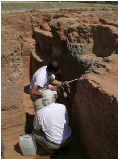
Figura 1. Mostreig arqueomagnètic en un dels forns del jaciment del Vila-sec (Alt Camp).

La datació arqueomagnètica d'un jaciment arqueològic requereix el coneixement previ de les variacions del camp magnètic terrestre a la zona del jaciment. Aquestes variacions es poden conèixer a partir de la lectura del senyal magnètic en jaciments d'edat coneguda que permeten realitzar models acurats del camp arqueomagnètic. Per a datar jaciments de Catalunya es disposa de dues eines: la corba de variació secular d'Ibèria i el model regional SCHA.DIF.3K. L'estudi arqueològic realitzat al jaciment romà del Vila-sec (Alt Camp), en col·laboració amb arqueòlegs de l'ICAC, ha permès datar-lo acuradament a partir de la tipologia de la ceràmica que s'hi produïa i comprovar que tant la corba ibèrica com el model regional són útils per a datar jaciments romans de Catalunya. Més endavant hem aplicat la mateixa estratègia de datació arqueomagnètica a cinc jaciments catalans més, entre els quals dos forns aïllats i sense restes ceràmiques que difícilment s'haurien pogut datar mitjançant altres tècniques.