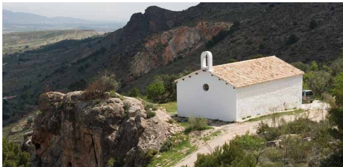
Ermita de la Virgen de la Cabeza (Serón).

Servicio de Protección del Patrimonio Histórico Dirección General de Bienes Culturales