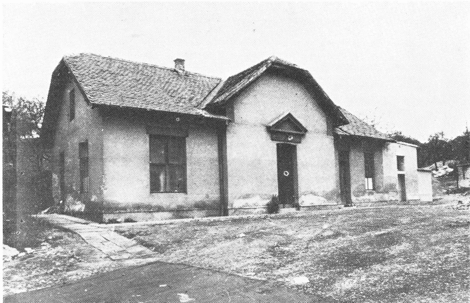
Stara dotrajala zgrada prosekture Zavoda za patologiju u vrijeme prije njena rušenja.