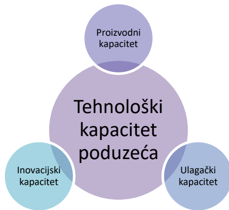
Slika 3: Tehnološki kapacitet poduzeća

je važan jer on predstavlja sposobnost poduzeća za stvaranje novih tehnologija, tj novih proizvoda, usluga i procesa koji se razvijaju u skladu s razvojem tržišta.