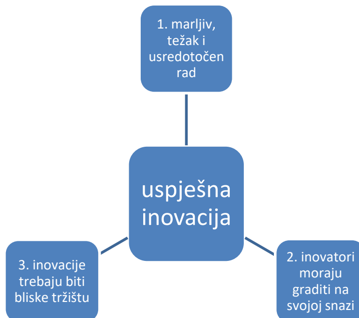
Slika 2: Tri uvjeta uspješne inovacije

Kako bi inovacija bila uspješna, prema Druckeru (2005) potrebno je zadovoljiti tri uvjeta. Sljedeća slika prikazuje odnos ta tri uvjeta uspješne inovacije: