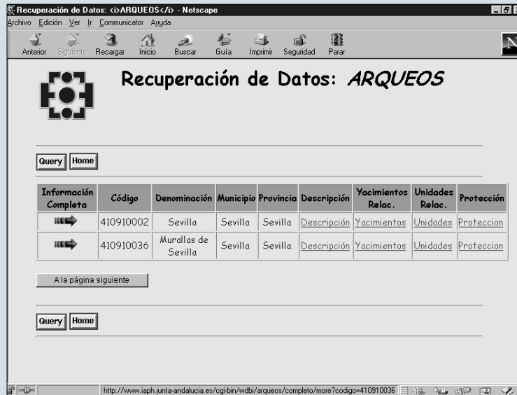
Listado previo de Resultados de ARQUEOS

El acceso a las Bases de Datos del Patrimonio Histórico en nuestro servidor se hará bien a través del botón PRODUCTOS CULTURALES, bien dentro del botón CENTRO DE DOCUMENTACIÓN (ambos en la página principal de nuestro servidor Web) bajo la denominación BASES DE DATOS DE PATRIMONIO HISTÓRICO. A través de ellos se tendrá acceso a una serie de formularios donde seleccionar, consultar, e imprimir la información deseada.