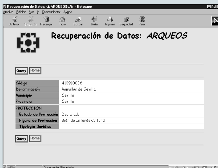
Salida parcial de datos: Protección