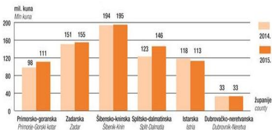
Graf 2: Ostvareni prihod luka nautičkog turizma bez PDV-a u 2014. i 2015.g.