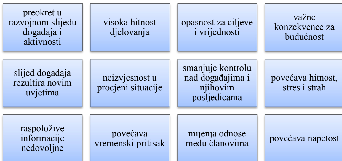
Slika 1: Dimenzije krize prema Wieneru i Kahnu

U poslovnom smislu, kriza je značajan poslovni poremećaj koji stimulira opsežnu medijsku pozornost (Schwartz ur. 2006:12). Nastalo temeljito proučavanje javnosti utjecat će na normalno poslovanje poduzeća, a može imati i politički, pravni, financijski i vladin utjecaj na poslovanje poduzeća (Verčič et al. 2004:132).