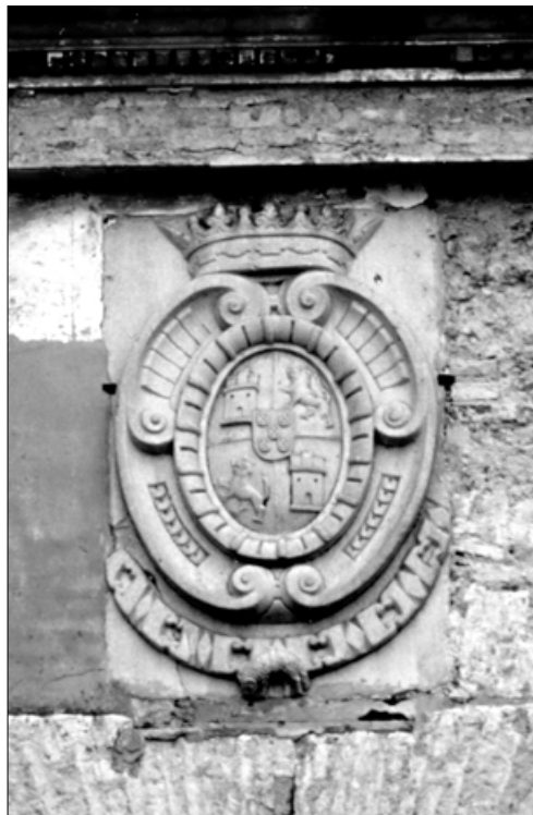
I. Salvador Rodríguez. Carmona. Puerta de Córdoba. Escudo real, 1608.

Al margen de la propia labor de cantería, cuyo alcance no podemos conocer con exactitud, Cardeno