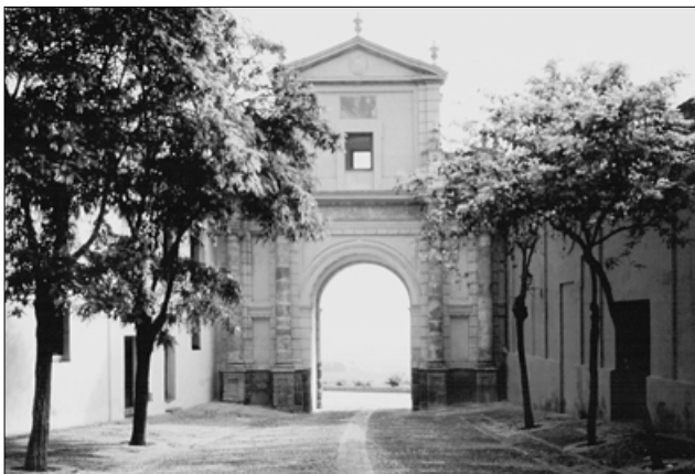
5. José Echamorro. Carmona. Puerta de Córdoba. Fachada exterior.