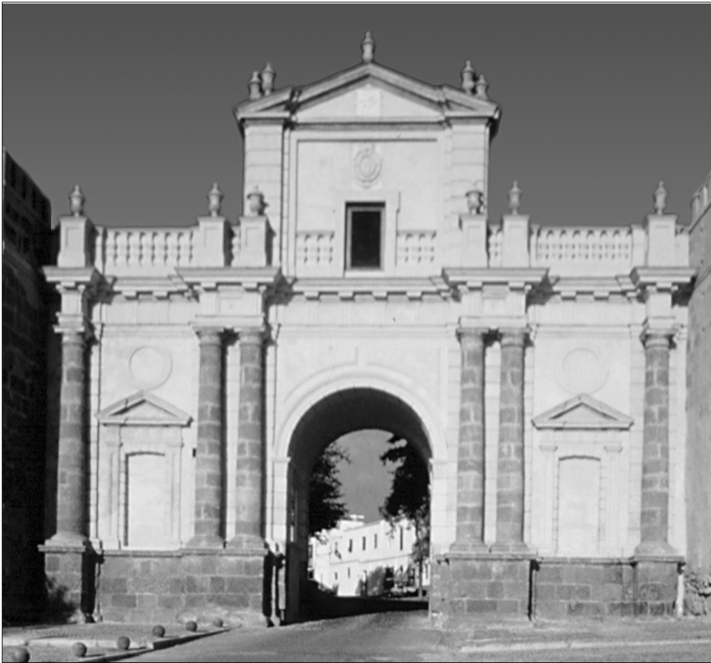
8. Sevilla. Puerta Nueva o de San Fernando. Fachada exterior. B. Tovar, 1878.