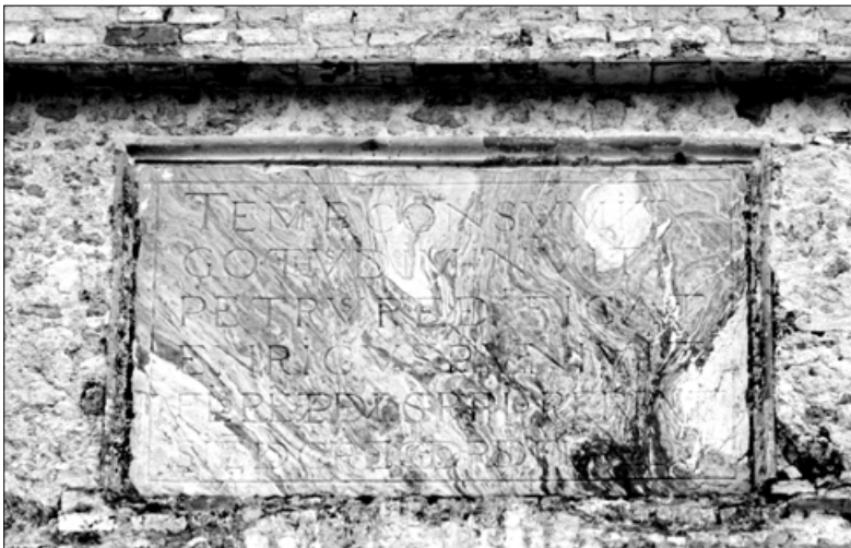
2. Carmona. Puerta de Córdoba. Lápida conmemorativa, 1608-1609.

"No porque en fuerte y levantada altura situada estoy, ó que de ricas mieses mis vegas me coronen, yo me ufano. No porque el sol desde su Oriente alegre mis muros bañe, ó tanto me engrandezca de mis vecinos la nobleza antigua. Mas soy tres veces más dichosa y grande de dos patronos por la gloria y lustre; ó bien de Teodomiro, hijo mio, ó bien Mateo, apóstol por el tuyo" 14 .