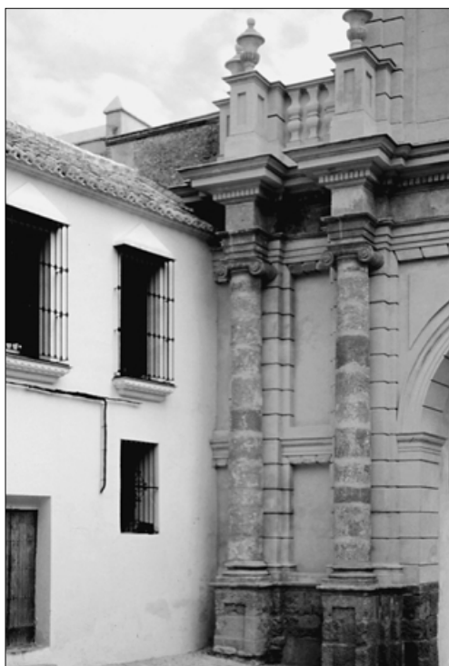
7. José Echamorro. Carmona. Puerta de Córdoba. Fachada interior. Detalle.

como remate. (Fig. 5) La fachada occidental, por su parte, presenta dobles columnas jónicas sobre basamentos apareciendo en los intercolumnios registros rectangulares. Culmina esta fachada en un entablamento liso, como corresponde a la concepción de una arquitectura de orden jónico. Aunque Echamorro transformó profundamente esta fachada, su articulación nos hace sospechar la posibilidad de que el arquitecto se viera mediatizado por estructuras preexistentes que le hicieran trazarla con menor libertad que la oriental. En este sentido, hay que recordar que la remodelación realizada entre 1608 y 1609, afectó fundamentalmente a la puerta interior; y que en los dibujos que realizaron Gregorio González, Gaspar Peña e Ignacio Moreno, en 1774 y 1775, donde mostraban la puerta exterior; ésta no parecía poseer elementos importantes como para ser tenidos en cuenta por nuestro arquitecto, a la hora de plantear la nueva traza. (Fig. 6)