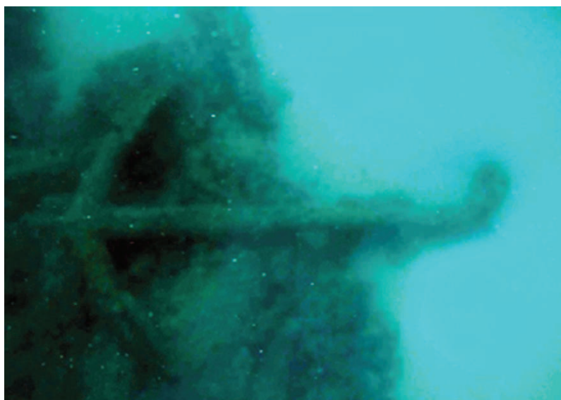
Figura 3. Ancla tipo almirantazgo detectada en el yacimiento (CAS-IAPH).