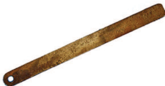
Regla empleada para medir las distancias en las cartas náuticas

de líneas paralelas mientras que en la externa contiene una numeración de la que solo son legibles los dos primeros dígitos «17», que quizás pudiera corresponderse con el año de fabricación de la pieza. Esta regla era empleada para el posicionamiento del navío en las cartas náuticas y el trazado de rutas de navegación.