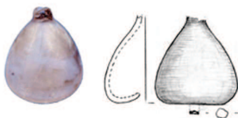
Reloj de arena empleado para calcular los nudos a los que navega el barco