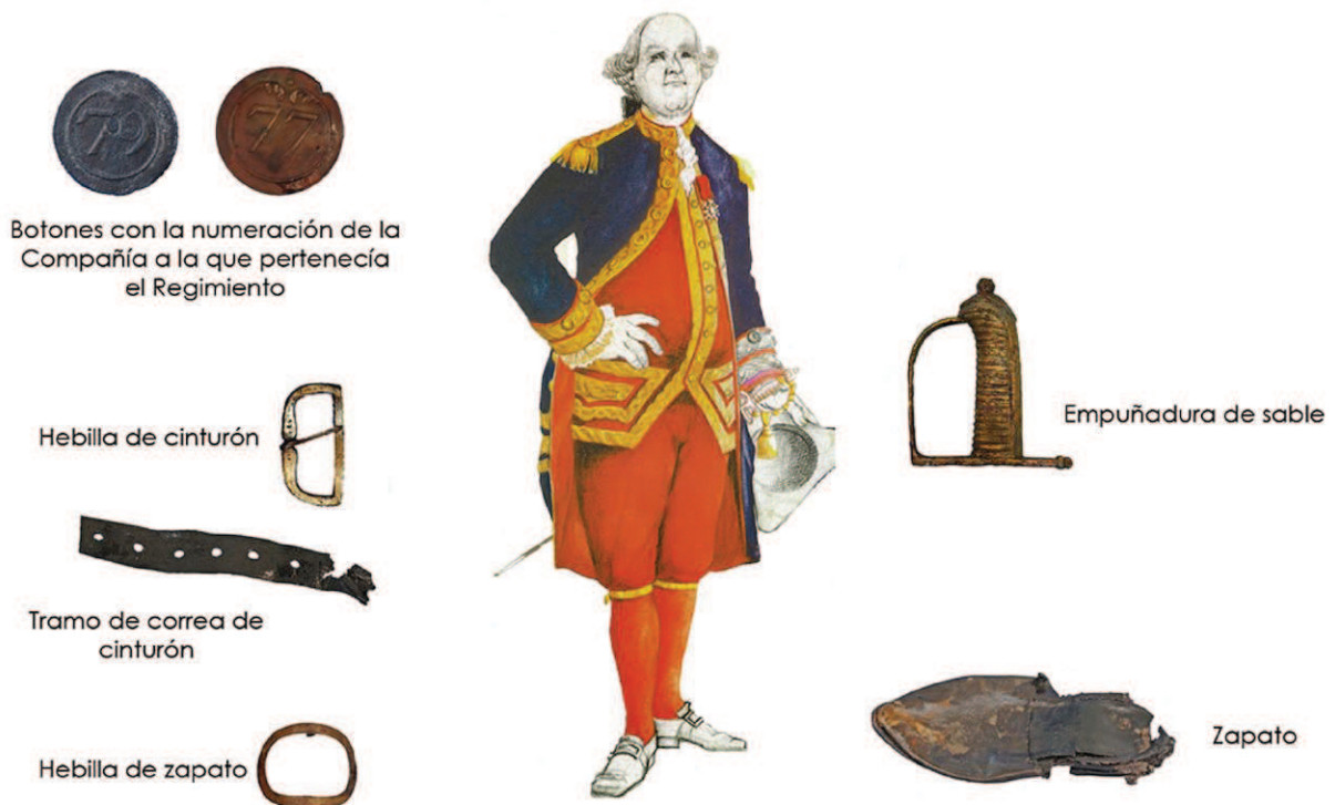
Figura 5. Indumentaria de un oficial de marina (CAS-IAPH) (Boudriot, 2000: T.IV, 14).

Finalmente, mencionar el hallazgo de objetos vinculados con la indumentaria de la tripulación: hebillas –asociadas al calzado, sombreros, arneses y, en general, en todas las combinaciones con el cuero (mochilas, zurrones, correajes, cinturones, etc.)–, botones –cada destacamento o regimiento militar presentaba su numeración en las abotonaduras del uniforme 5 –, insignias, alfileres, cinturones y calzados (fig. 5).