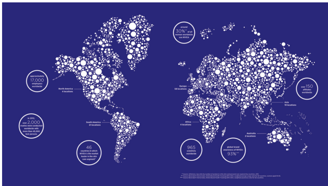
Slika 16: Prisutnost Nivea proizvoda diljem svijeta