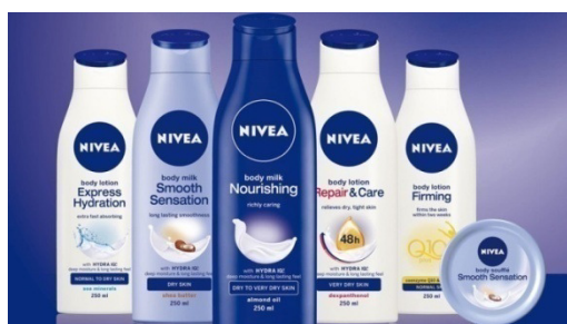
Slika 9: Nivea proizvodi za njegu tijela