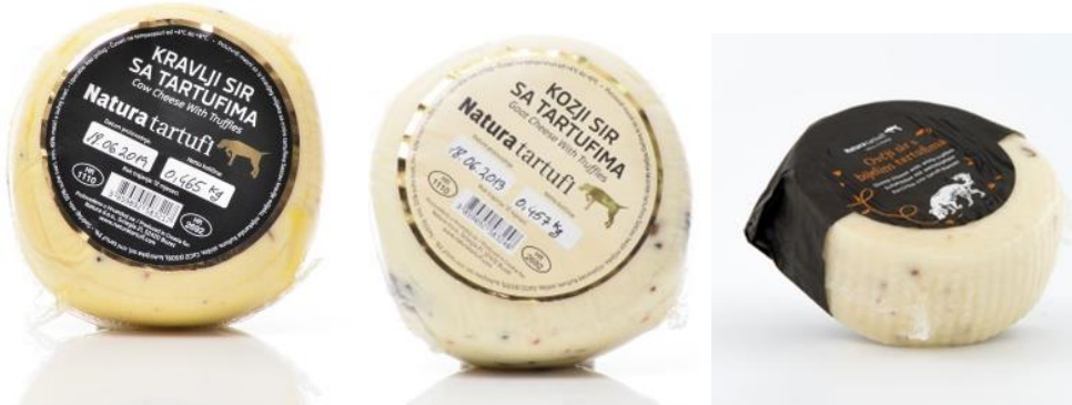
Slika 8.: Sir od tartufa