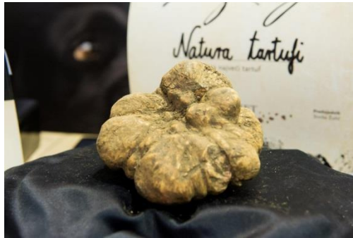
Slika 13: Najveći tartuf na „Tuber fest“ u Livadama