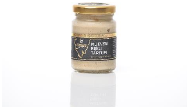
Slika 6.: Mljeveni bijeli tartuf.