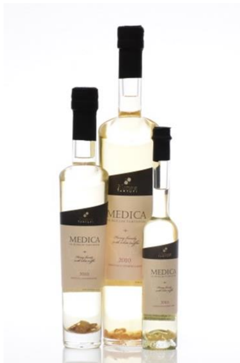
Slika 9. : Medica od tartufa