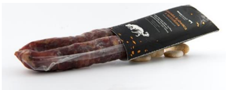
Slika 7. : Istarska kobasica s tartufima

Jedini i najbolji način konzumiranja ovog delikatesa je da ga ručno prerežete na kolute. Istarski recept za suhu kobasicu je: kvalitetno svinjsko meso, grubo mljeveno, pomiješano s kuhanim vinom na koju se dodaju češnjak i paprika kako bi zajedno prokuhali. Kada se smjesa ohladi, tada se puni u prirodno svinjsko crijevo. Nakon što je prošlo određeno vremensko razdoblje, a kobasica je sušena, pakirana i spremna za konzumaciju.