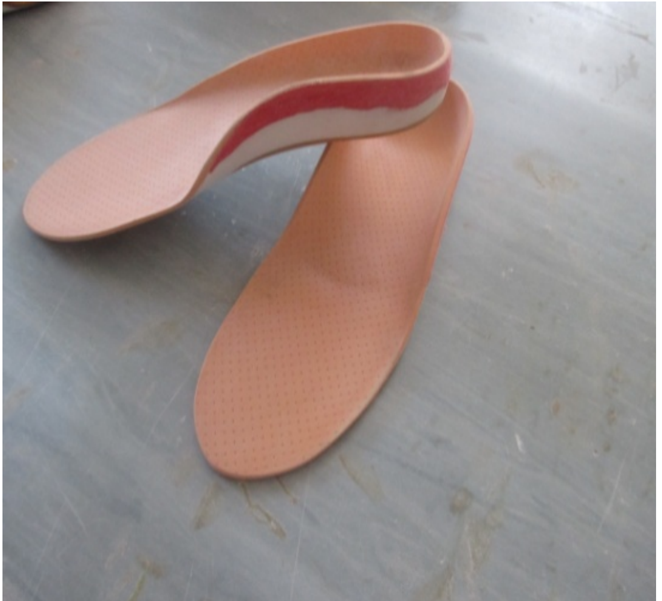
Slika 6: Dječji ulošci