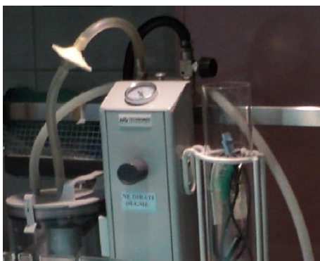
Slika 3. Aspirator

Oprema za reanimaciju treba također biti lako dostupna ili pripremljena.