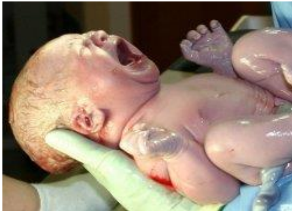
Slika 1. Terminsko novorođenče