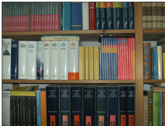
Abb. 1: Der Historiker ist zunächst und vor allem Autor: Trotz aller medialen Pluralisierung bleibt der Text das Leitmedium der Geschichte als Wissenschaft, sowohl als Quelle wie als Darstellungsform.

Präziser formuliert, führt das vorliegende Kursbuch mit seinen Arbeitshilfen zu genau dieser ‚Übersetzungsleistung‘ hin: zu den Besonderheiten des historischen Erzählens.