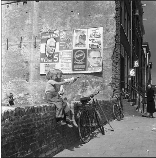
Abb. 4: Die ‚Säulen‘ und ihre Parteien: hier u. a. Wahlwerbung in den 1950er Jahren für den rechtsliberalen Politiker P.J. Oud (1886-1968), links oben, und für den langjährigen sozialdemokratischen Premier (1948-1958) Willem Drees (1886-1988), rechts unten. 185