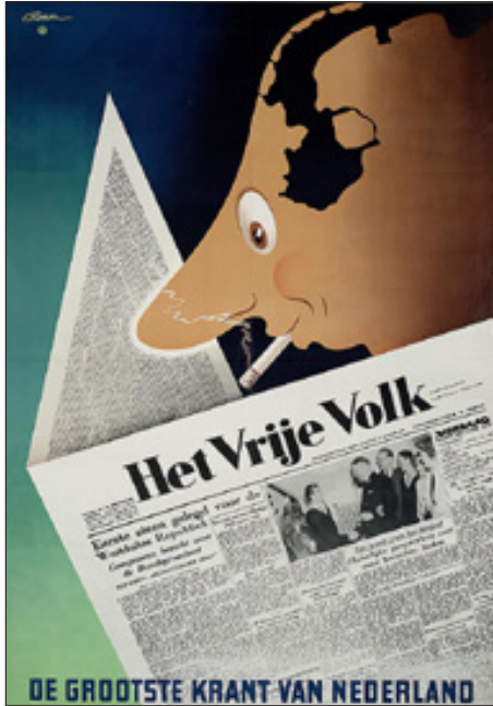
Abb. 5: Jede ‚Säule‘ hatte ihre Medien: bis 1961 gehörte zur sozialistischen Säule die Zeitung ‚Het Vrije Volk‘ 186 An der niederländischen Presse- und Rundfunklandschaft lässt sich ihre Entstehung in der Versäulungszeit z.T. noch bis heute erkennen.

Mobilität den Versäulungskonsens und vor allem ihre überlieferten kirchlichen Bindungen in Frage, so dass sich die Niederlande schnell von einer exemplarisch versäulten zu einer exemplarisch individualisierten und permissiven Gesellschaft entwickelten.