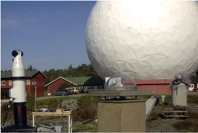
Abb. 1: IGS-Referenzstation und Radom des VLBI-Radioteleskops