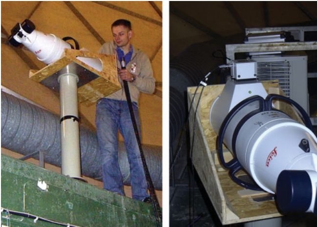
Abb. 4: Trackerinitialisierung (links), Neigungssensor auf Tracker zur Stabilitätskontrolle (rechts)

in der Nähe der Elevationsachse anzumessen. Gelöst wurde dies durch einen Pfeileradapter, der den Lasertracker in horizontaler Ausrichtung im Netz platzierte (siehe Abbildung 4, links). Da der Lasertracker über keinerlei Horizontiereinrichtungen verfügt und mittels Transformation im Netz stationiert wird, ergeben sich hierdurch auch keine Diskrepanzen innerhalb der Netzauswertung. Zur Stabilitätsüberwachung der geneigten Standpunkte wurde ein Zwei-Achs-Neigungssensor eingesetzt und auf dem Lasertracker platziert (siehe Abbildung 4, rechts). Eine 48-stündige Voruntersuchung ergab, dass keine Langzeitstabilität gewährleistet ist. Die Dauer der Vermessungsarbeiten war daher auf ein Minimum zu reduzieren, um den Neigungseinfluss auf die Messung gering zu halten. Durch gezielte Verfahrenen des Teleskops betrug die Gültigkeitsdauer eines Standpunktes im Schnitt lediglich 30 Minuten.