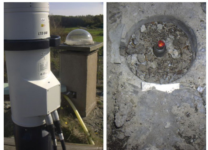
Abb. 3: Lasertracker vor IGS-Monument (links), CCR-0.5'' auf IGS-Referenzbolzen (rechts)

Der zweite limitierende Faktor ist der Lasertracker selbst. Dieser hat einen eingeschränkten vertikalen Arbeitsbereich von \pm 45^\circ und ist daher nicht in der Lage, Punkte