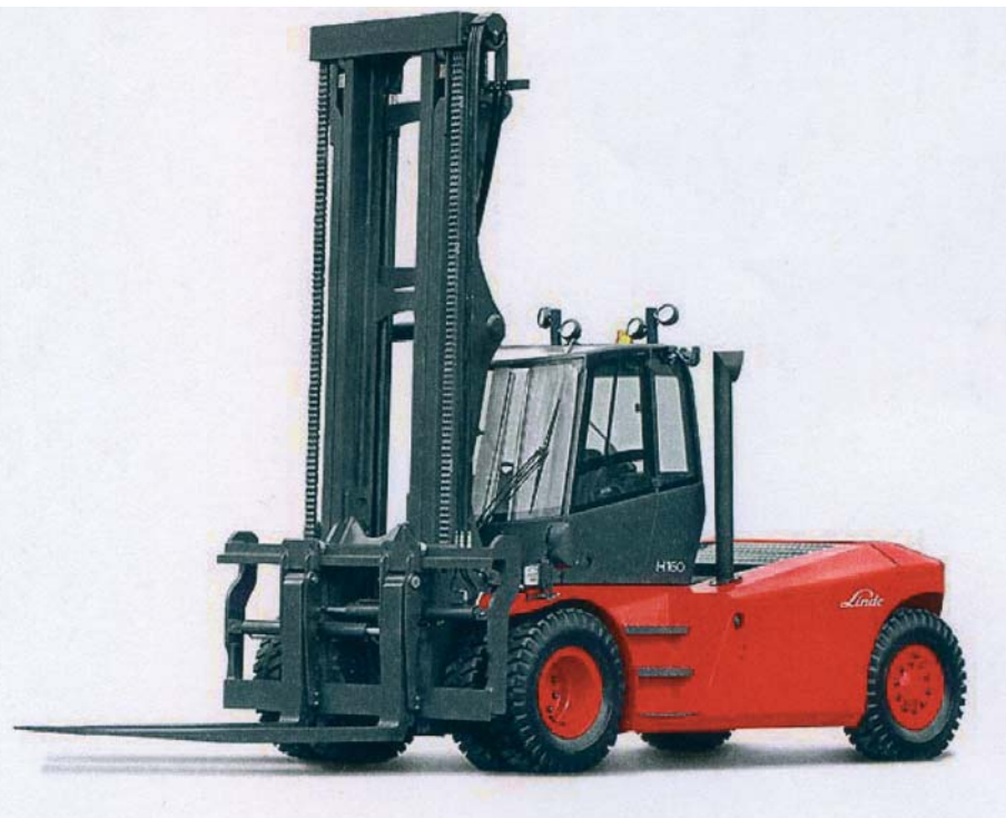
1: Linde-Dieselloßstapler mit Hydrostatik-antrieb in der Tragklasse von 10 bis 18t

Hub- bzw. Neigefunktion ausgeführt wird. Ebenfalls entfällt das bisher notwendige „Inchen“ des Staplers, bei gleichzeitiger Ansteuerung von Fahr- und Hubfunktionen. Dies und die deutlich gestiegenen Hub- und Senkgeschwindigkeiten des Hubmastes führen zu Zeit- und Kostenersparnissen und schlagen sich im Ergebnis in einer höheren Wirtschaftlichkeit nieder.