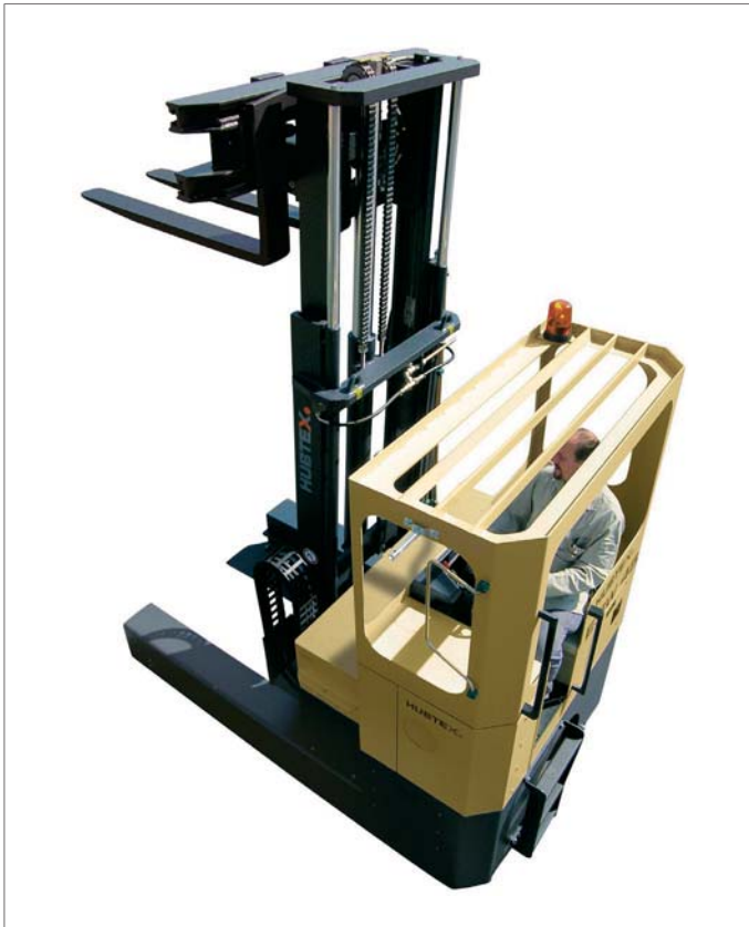
HUBTEX Maschinenbau GmbH &amp; Co. KG