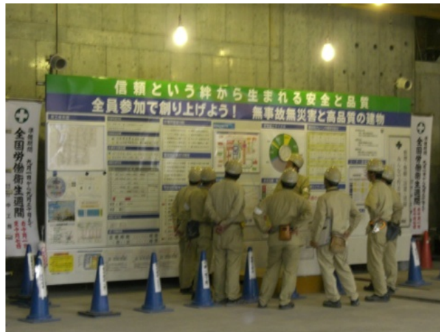
Abbildung 1. Baubesprechungen in Japan [Hofacker09]

In der stationären Fertigungsindustrie werden Shop-Floor-Management 1 Konzepte in der Produktion häufig eingesetzt, um Prozesstransparenz bezüglich Leistung und auftretenden Fehlern zu schaffen. Im Sinne der Lean Production werden die Ausführenden dabei in den Prozess der Visualisierung und die Findung von Problemlösungen mit einbezogen, sodass kontinuierliche Verbesserungsprozesse „vor Ort“ geschaffen werden. Dadurch sollen Fehler vermieden und somit ein stetiger Produktionsfluss, insbesondere auf Fertigungslinien erreicht werden 2 . Im Bauwesen, welches projektbasiert fertigt, haben sich insbesondere in Brasilien und Japan kreative Baumanagementansätze entwickelt, die auf dem Prinzip der Transparenz basieren. Während auf Baustellen in Brasilien zur Transparenzsteigerung und Problemsignalisierung Andon-Systeme entwickelt wurden 3 , ist das japanische Konzept zur Visualisierung der Leistung und Prozessabläufe durch bestimmte Formen der Besprechung und eines transparenten Tagesablaufs geprägt. 4