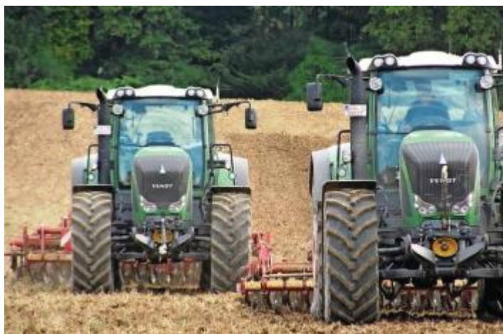
Mittels elektronischer Deichsel gekoppelte Prototypen bei einer Testfahrt

Elektronische Deichsel für landwirtschaftliche Arbeitsmaschinen