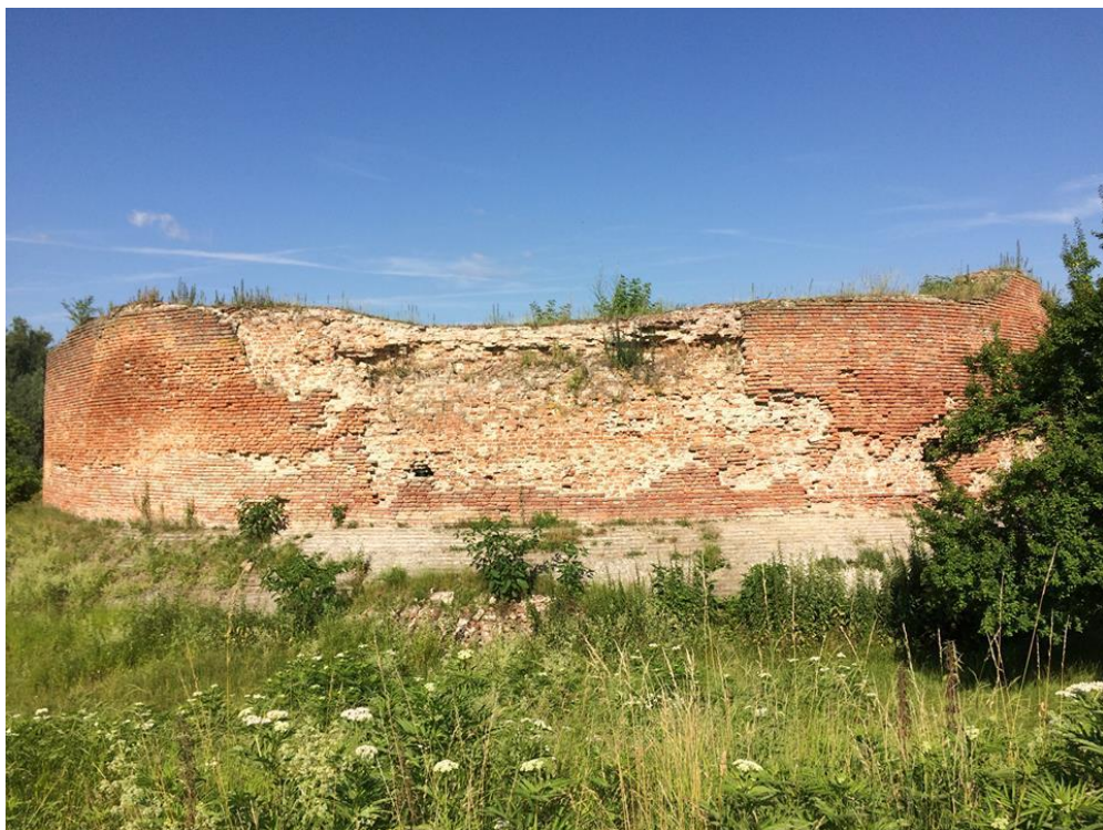
Prilog 8: Masivni i zaobljeni zidovi Korogyvara – ključno obilježje renesansne vojne arhitekture.