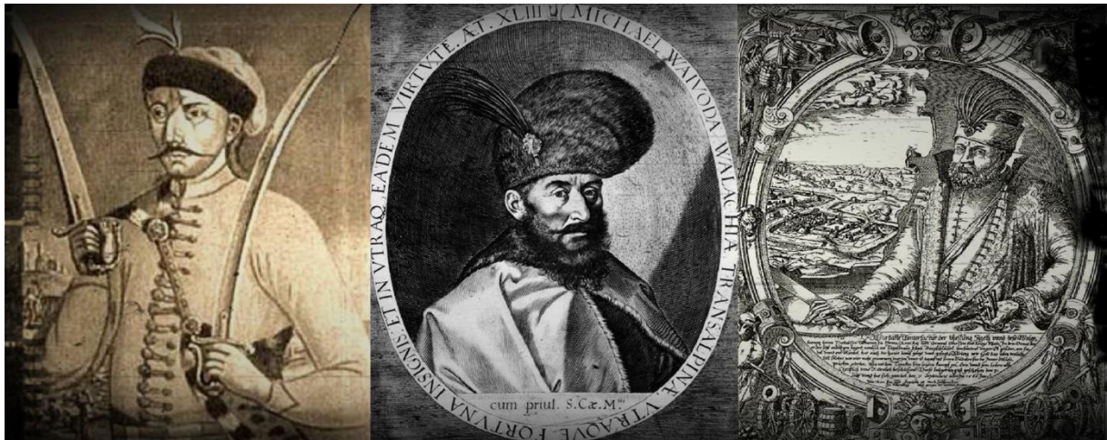
Prilog 11: Usporedni prikaz trojice vojnih zapovjednika iz triju različitih država (Pal Kinizsi – lijevo, Mihai Hrabri – sredina, Nikola Zrinski – desno) koji su se borili protiv Turaka. Premda vremenski razmaknuti gotovo jedno stoljeće, njihova odjeća odaje izuzetan orijentalni utjecaj – dugi ogrtači, krznena odjeća, kalpaci, ukrasno perje, upotreba sablji umjesto mačeva i drugo.