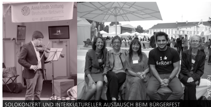
SOLOKONZERT UND INTERKULTURELLER AUSTAUSCH BEIM BÜRGERFEST