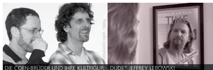
DIE COEN-BRÜDER UND IHRE KULTFIGUR: „DUDE“ JEFFREY LEBOWSKI