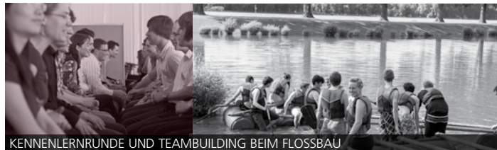
KENNENLERNRUNDE UND TEAMBUILDING BEIM FLOSSBAU

Teambuilding, Zeit- und Selbstmanagement, Interkulturalität: In der Berufswelt sind Kompetenzen gefragt, die zusätzlich zum Studium fachübergreifend erworben werden können. Das ZAK arbeitet seit 2008 erfolgreich mit namhaften Unternehmen zusammen, um den gezielten Erwerb wichtiger Schlüsselkompetenzen zu fördern. Das studienbegleitende Programm unterstützt ausgewählte Studierende des KIT – vor allem der Ingenieur- und Naturwissenschaften – in ihrer Persönlichkeitsentwicklung und bei ihrem Weg in den Beruf. Die Beteiligten absolvieren unterschiedliche Trainings, erhalten Einzelcoachings und lernen die beteiligten Unternehmen kennen. Auch ein vergütetes Praktikum in einem der Partnerunterneh-