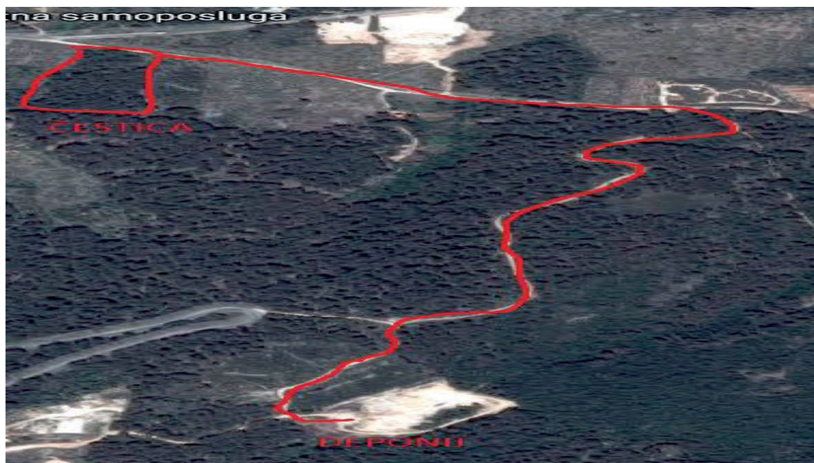
Slika 3. Udaljenost deponija od iskopa [3]