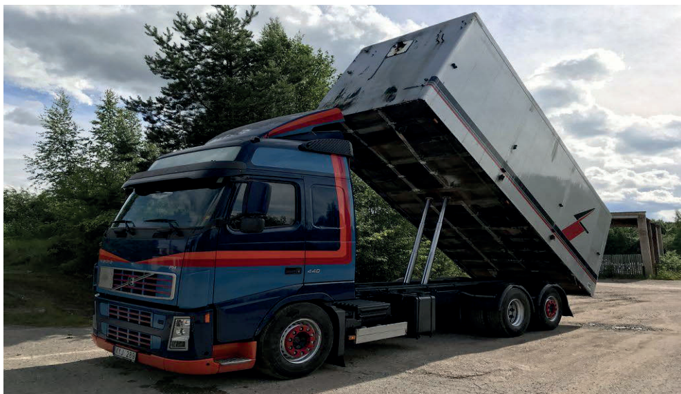
Slika 16. Kamion kiper VOLVO FHI 2 [16]

Ukupna količina materijala za dovoz; Q_{\text{materijala}} = 1168,56 \text{ m}^3