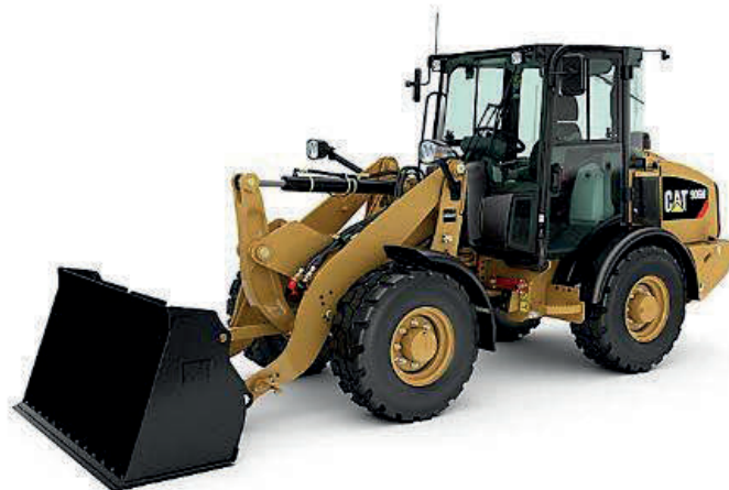
Slika 11. Utovarivač CAT 906M [11]