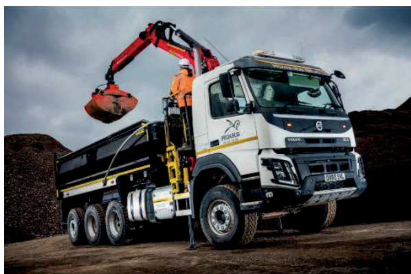
Slika 14. Kamion kiper VOLVO FH [14]

Nakon iskopa materijala vrši se ukrcaj u kamion kiper VOLVO FH (Slika 14.), te nakon punjenja odvozi materijal na deponij udaljen 2 km.