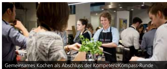
Gemeinsames Kochen als Abschluss der KompetenzKompass-Runde

Welches Potenzial steckt in mir und wie aktiviere ich es? Was erwartet ein Arbeitgeber von mir? Wie wachsen wir als Team zusammen? Antworten auf diese und weitere Fragen erarbeiten Studierende im KompetenzKompass, einem Programm des KIT zur Persönlichkeits- und Karriereentwicklung, das in enger Kooperation mit Unternehmen aus der Region in eine neue Runde startet. Als neuer hochkarätiger Partner neben der SEW-EURODRIVE GmbH & Co KG konnte das in Pforzheim ansässige Unternehmen WITZENMANN GmbH gewonnen werden. Aus vielen exzellenten Bewerbungen wurden insgesamt 20 Teilnehmerinnen und Teilnehmer ausgewählt, die sich im Laufe der kommenden zwei Jahre sowohl in Seminaren zu Internationalem Projektmanagement, Interkulturellen Kompetenzen, Innovationsmanagement, Selbstführung oder ethischem wirtschaftlichem