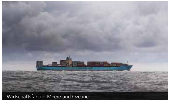
Wirtschaftsfaktor: Meere und Ozeane

Das Meer fasziniert die Menschheit seit jeher. Als Ursprung des Lebens und als Lebensraum unzähliger Tiere und Pflanzen ist es ein wesentlicher Bestandteil des Ökosystems. Obwohl über 70 Prozent der Erde von Ozeanen und Meeren bedeckt sind, sind davon fast 90 Prozent weitgehend unerforscht – vor allem die Tiefsee. Die Weltmeere sind in vielfacher Hinsicht für die Menschen wichtig, sei es als Nahrungsquelle, Wirtschaftsraum oder als Beeinflusser des Weltklimas. Trotzdem achtet die Menschheit nur ungenügend auf deren Schutz und Erhalt. Ozeane werden vielfach als „Müllkippe“ missbraucht – Industrieabwässer, Hausmüll oder Dünger aus der Landwirtschaft dringen oft ungehindert in die Meere. Jährlich gelangt auch tonnenweise Plastik ins Wasser und zerfällt mit der Zeit zu sogenanntem Mikroplastik – mit noch ungeahnten Folgen für die Umwelt und den Menschen. Eine nachhaltige Nutzung der Meere wäre jedoch von großer Wichtigkeit angesichts der Tatsache, dass diese unzählige Arbeitsplätze weltweit schaffen, sei es im Fischfang, in der Frachtschifffahrt oder im Tourismus. Neben den traditionellen Nutzungsmöglichkeiten der Meere eröffnen neue Technologien verstärkt auch neue Potenziale zur wirtschaftlichen Nutzung der Ozeane. Hierunter fallen neue Arten der Energieerzeugung wie Offshorewindparks und Gezeitenkraftwerke. Das größte Augenmerk legt die Wirt-