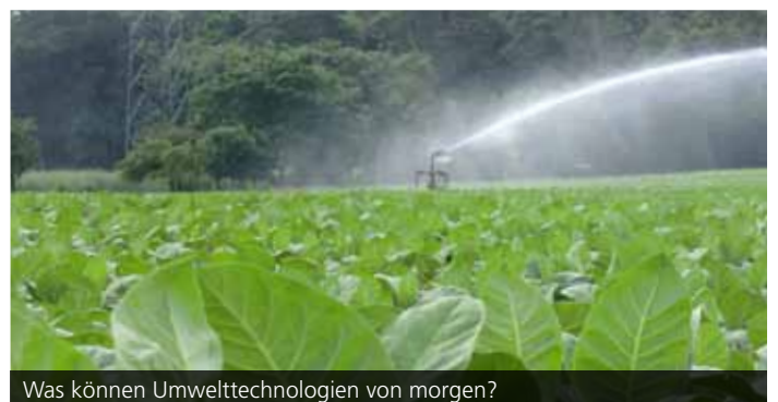
Was können Umwelttechnologien von morgen?

ständlicher Vorträge im Bürgersaal des Karlsruher Rathauses Einblicke in ihre Arbeit. Die vom ZAK koordinierte Veranstaltung richtet sich an alle Interessierten. Ganz besonders willkommen sind Schülerinnen und Schüler. Im Anschluss bietet ein Stehempfang im Oberen Foyer die Möglichkeit zur Diskussion und zur Besichtigung einer kleinen Ausstellung zur Arbeit des Zentrums. Informationen zum Programm unter: www.zak.kit.edu/kit_im_rathaus .