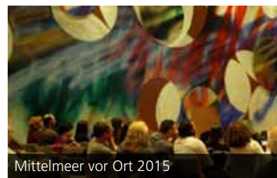
Mittelmeer vor Ort 2015

ruhe e.V. ausgewählte Kurzfilme junger israelischer Regisseurinnen und Regisseure gezeigt wurden. Die jungen Filmemacher sind Teil einer neuen israelischen Generation, ihre Kurzfilme greifen die Vielschichtigkeit der israelischen Gesellschaft