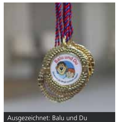
Ausgezeichnet: Balu und Du

Zahlreiche Karlsruher Einrichtungen unterstützen die außerschulischen Aktivitäten der „Balus“ und „Moglis“. So dürfen die Gespanne in ihrer gemeinsamen Zeit kostenfrei in das Naturkundemuseum, das ZKM und den Zoologischen Stadtgarten. Das Europabad gewährt einen freien Eintritt während des Jahres der Patenschaft. Für das Jahr 2015 erhielt das Programm Spenden vom Lions Club Karlsruhe-Zirkel e.V. und von der KIT-Stiftung. Im Sommersemester startet die neue Runde. Am Donnerstag, 5. Mai 2016 findet ein Fest zum Kennenlernen im Zirkus Maccaroni in Karlsruhe statt, bei welchem alle „Balus“ und „Moglis“ des neuen Jahrgangs mit ihrer neuen Partnerschaft beginnen. Wissenswertes zum Programm gibt es unter: www.zak.kit.edu/balu_und_du .