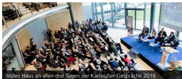
Volles Haus an allen drei Tagen der Karlsruher Gespräche 2016