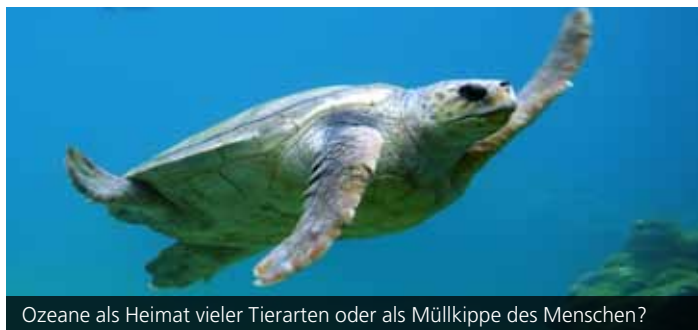
Ozeane als Heimat vieler Tierarten oder als Müllkippe des Menschen?

Anlässlich des Wissenschaftsjahres 2016*17 „Meere und Ozeane“ wird im Sommersemester 2016 der Schwerpunkt auf die Forschung rund um diesen Lebensraum gelegt, um einen aktuellen Einblick in die damit verbundenen Wissenschaftszweige zu geben. Drei große Themenfelder stehen im Mittelpunkt des Wissenschaftsjahres, an welche auch das Colloquium anknüpfen möchte: Entdecken. Nutzen. Schützen. Wie kann die Meeresforschung dazu beitragen, gesicherte Daten zu erhalten, um zu helfen, den Lebensraum Ozean besser verstehen zu lernen, besser nutzen zu können und dabei aber vor allem auch besser schützen zu können? Im Rahmen des Colloquium Fundamentale werden Fragen wie folgende kontrovers diskutiert: Wie groß sind die Risiken eines Tiefseebergbaus, um die immer begehrteren Rohstoffvorkommen am Meeresboden zu gewinnen? Wie stark dürfen die Ozeane durch die zunehmende Frachtschifffahrt ausgelastet werden, ohne den Lebensraum zu gefährden? Wie kann die zunehmende Verschmutzung der Meere vor allem durch Mikroplastik gestoppt bzw. rückgängig gemacht werden? Das Colloquium „Mensch und Meer: Zwischen Nutzen und Ausbeutung“ eröffnet Prof. Dr. Reinhold Leinfelder von der Freien Universität Berlin am Donnerstag, 12. Mai 2016 um 18.30 Uhr im NTI-Hörsaal mit dem Vortrag „Welterbe Ozean“. Nähere Informationen und alle Termine unter: www.zak.kit.edu/colloquium_fundamentale .