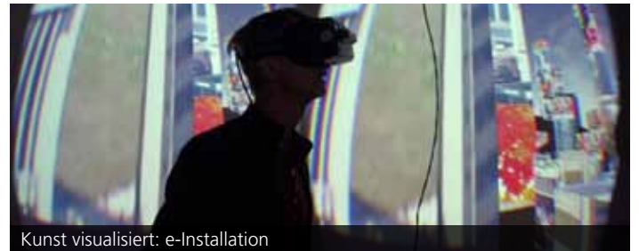
Kunst visualisiert: e-Installation