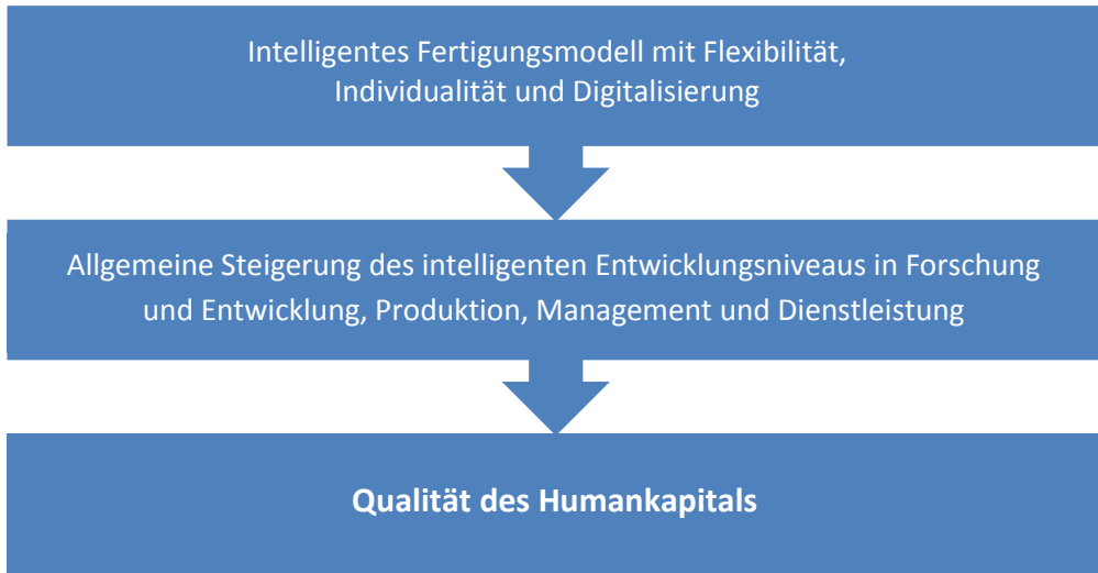
Abb. 1 Verfahren zur Umsetzung von „Made in China 2025“