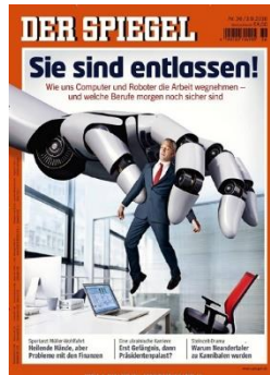
Abb. 2: DER SPIEGEL 36/2016