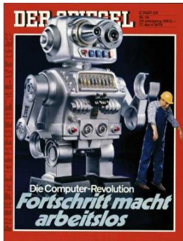
Abb. 1: DER SPIEGEL 16/1978