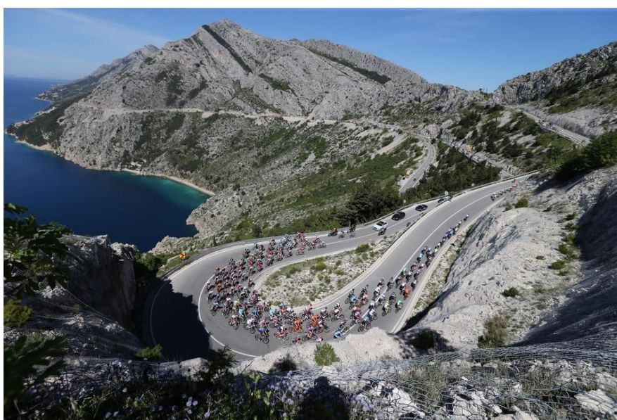
Slika 3. Konfiguracija terena na državnoj cesti D8 u blizini Makarske.[5]

Prostorni raspored javnih cesta u izravnoj je vezi s konfiguracijom terena (reljefom), naseljenošću ali na njega utječu i druge prilike (klimatske, geološke, ekološke). Jedna od glavnih poveznica županije uz autocestu je i državna cesta D8, poznata kao Jadranska magistrala koja najvećim djelom prolazi uz priobalje. Na velikom djelu uz obalu konfiguracija je terena vrlo pristupačna, te se pruža prekrasan pogled na otoke. Na slici 3. uočava se način prostornog vođenja trase, njeno prilagođavanje terenskim prilikama, ali atraktivnost okoliša kojim prolazi. Izgradnja dionice od Šibenika do granice sa Crnom Gorom trajala je od 1963. do 1965. godine, te je za to vrijeme izgrađen 291 kilometar na dotad nepristupačnom terenu, a dugo je vremena bila jedina poveznica naselja uz obalu.