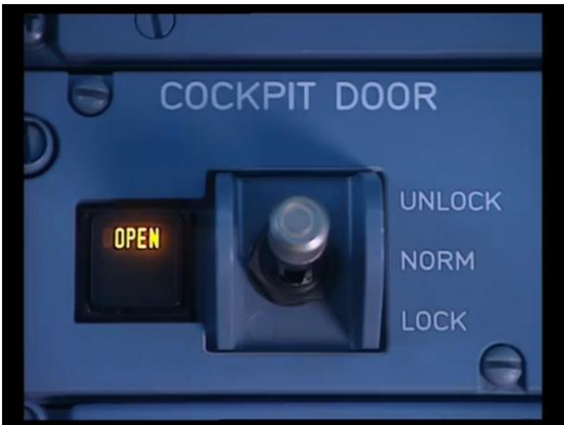
Slika 11. Sustav za automatsko zaključavanje te otključavanje vrata cockpit-a

Ako je putnik nasilan, zaključavaju se vrata cockpit-a koja moraju imati ručni ili automatski sustav zaključavanja i biti otporna na pokušaj nasilne provale u cockpit te moraju sadržavati kameru s kojom letačko osoblje može promatrati situaciju ispred vrata (ukoliko je primjenjivo na tipu zrakoplova). Izgled sustava za automatsko zaključavanje vrata cockpit-a te izgled sustava za ručno zaključavanje vrata cockpit-a dani su na slikama 11 i 12. Zapovjednik zrakoplova, ukoliko smatra da za to postoji potreba, informira kontrolu zračnog prometa o postojanju ovakvog putnika te zahtjeva pomoć nakon slijetanja zrakoplova. Zapovjednik zrakoplova mora provjeriti jesu li nakon proživljenog incidenta svi ostali članovi posade sposobni za obavljanje svojih dužnosti te mora osigurati da je kompanija izvještena o počinjenom incidentu u slučaju medijskog interesa. 10