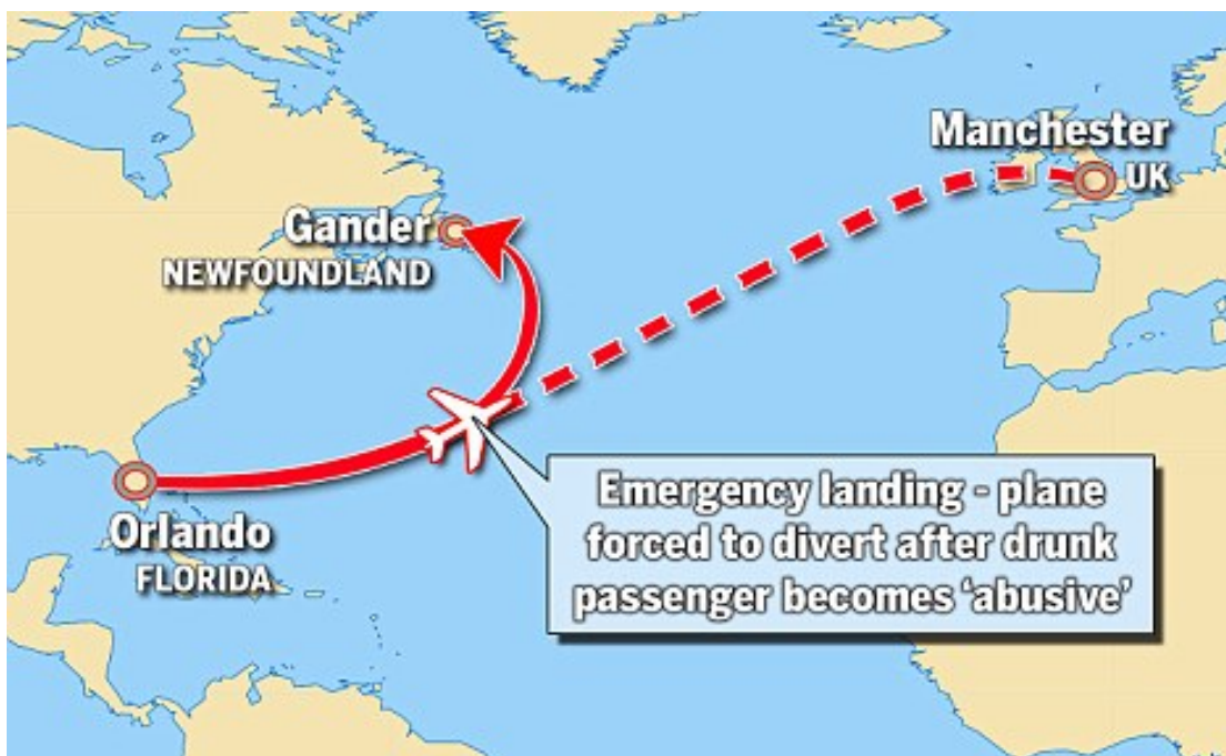
Slika 6. Preusmjeravanje zrakoplova zbog incidenta uzrokovanog unruly putnikom