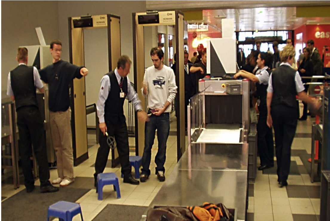
Slika 3. Sigurnosna provjera putnika