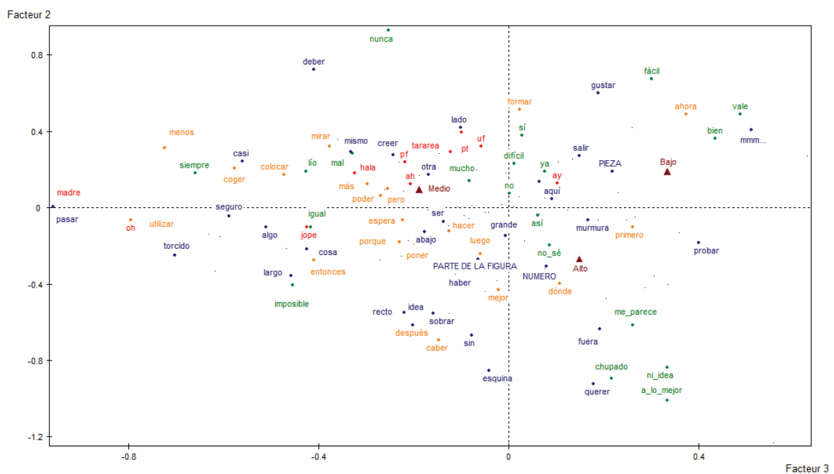
Figura 2. Análisis factorial de correspondencias de la tabla léxica agregada con las palabras contributivas y niveles de dificultad.

El segundo análisis factorial sobre la tabla léxica agregada permite identificar los grupos léxicos en relación a la dificultad de la tarea. La Figura 2 muestra la distribución léxica en los ejes 2 y 3, incluyendo las palabras con una contribución mayor a la media, es decir, aquellas más representativas en el modelo. Se han elegido estos ejes ya que en este modelo son los que explican mayor cantidad de inercia en la variable dificultad.