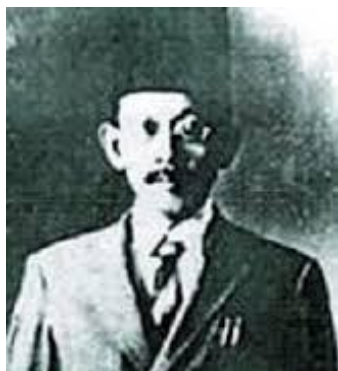
Gambar 2: Sheikh Mohammad Tahir Jalaluddin (1869-1956M): Lambang kecemerlangan ilmu falak yang dibawa dari Asia Barat