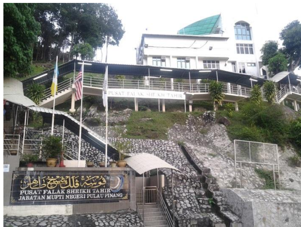
Gambar 4: Pusat Falak Sheikh Tahir di Balik Pulau, Pulau Pinang: Nama beliau diabadikan atas sumbangan besar beliau dalam ilmu falak di Malaysia.

Pusat Falak Sheikh Tahir ( Gambar 4 ) yang terletak di Pulau Pinang mengambil nama tokoh falak negara kita iaitu Sheikh Mohammad Tahir Jalaluddin (1869-1956M). Menurut Mohammad Ilyas (1996), pada asalnya pusat ini dikenali sebagai 'Pusat Astronomi Islam' pada tahun 1988 dan 'Pusat Ilmu Falak Sheikh Tahir' pada tahun 1991 selepas dibuka secara rasmi pada Oktober 1991. Manakala Kompleks Falak Al-Khawarizmi ( Gambar 5 ) pula mengambil nama tokoh falak dari Asia Barat yang dilahirkan di Khawarizm iaitu al-Khawarizmi 6 . Menurut Rahman (1983), karangan beliau yang terkenal ialah al-Kitab al-Mukhtasar fi Hisab al-Jabr wa al-Muqabalah . Begitu juga dengan nama al-Biruni 7 . Nama al-Biruni pula telah dinamakan pada balai cerap Astrofiqh di Sabah iaitu Balai Cerap al-Biruni ( Gambar 5 ). Selain mahir dalam bidang falak, beliau juga mahir dalam bidang matematik, geografi dan fizik dan salah satu karangan beliau yang terkenal ialah Kanun al-Mas'udi (Zaheril, 2007).