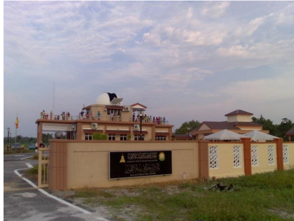
Gambar 1: Balai Cerap Negeri Selangor di Sabak Bernam: Ini adalah balai cerap Astrofiqh terkini di Malaysia menawarkan pengajaran peralatan astrofiqh tradisional iaitu rubu' mujayyab.

Pada hakikatnya, lima buah balai cerap ini merupakan tapak asal aktiviti cerapan hilal bulanan yang telah dijalankan suatu ketika dahulu. Kemudiannya telah dibangunkan sebagai sebuah balai cerap untuk meluaskan lagi fungsi dan peranannya dalam mengembangkan ilmu falak kepada masyarakat. Balai Cerap Astrofiqh yang pertama dibina ialah Pusat Falak Sheikh Tahir yang telah dibuka secara rasminya pada pada hari Rabu, 09 Oktober 1991 bersamaan 30 Rabiul Awal 1412H. Pusat ini terletak di Pantai Acheh, Balik Pulau, Pulau Pinang iaitu pada kedudukan koordinatnya di latitud 5^{\circ} 21' Utara dan longitud 100^{\circ} 12' Timur dengan ketinggian dari aras laut ialah 40 meter. Kedudukan yang strategik ini telah menjadikan balai cerap ini sebagai pusat kajian ilmu falak dalam pelbagai aspek seperti cerapan hilal, kajian senja, pemupusan dan pembiasan atmosfera dan sebagainya. Balai cerap ini telah diurus tadbir oleh Jabatan Mufti Negeri Pulau Pinang 2 .