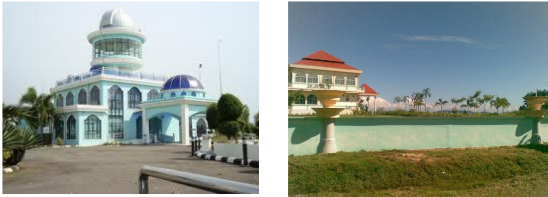
Gambar 5 - Kompleks Falak Al-Khawarizmi di Melaka (kiri) dan Balai Cerap Al-Biruni (kanan) di Sabah: Kedua-dua balai cerap ini menggunakan nama tokoh falak Asia Barat menunjuk pengaruh dan nilai Asia Barat wujud dalam balai cerap Astrofiqh di Malaysia.