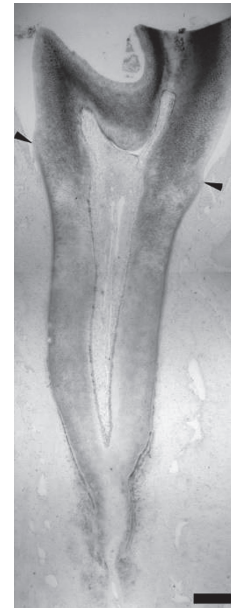
図 1 8 週齢ラット第一臼歯パラフィン切片に対する抗 DSP 抗体を用いた免疫染色像 矢頭は歯頸線を示す。歯冠部で歯根部より濃染しており、DSP がより多く局在していることが示唆される。Bar は 200 \mu m

前節では、歯冠と歯根の物性について考察したが、これら象牙質形成のメカニズムの差を考える上でもヒントとなり得るのが、遺伝子疾患の表現型である。ヒト疾患では、常染色体優性の遺伝子疾患である Dentin dysplasia (DD) において、歯根形成に顕著な異常を示す例が報告されている 12) 。この DD は、Shields ら 13) によって、Type I (dentin dysplasia) および Type II (anomalous dysplasia of dentin) に分類され、Witkop 14) により、DD-I (radicular dentin dysplasia) と DD-II (coronal dentin dysplasia) に分類された。このうち DD-II は、これまでの研究によって、DSPP (dentin