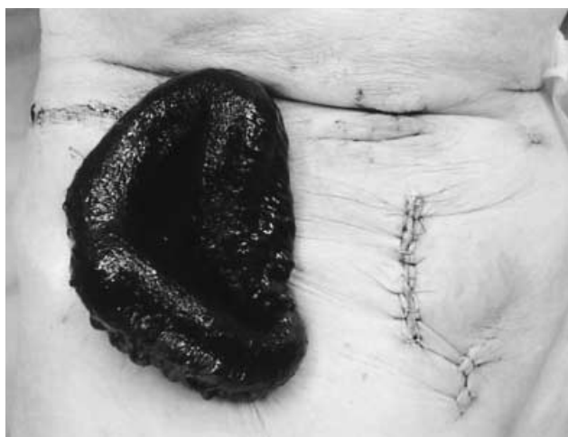
図3 ドレーン抜去部から小腸が脱出し壊死所見を伴っていた。