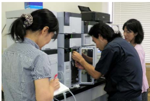
図2 カラム接続の様子