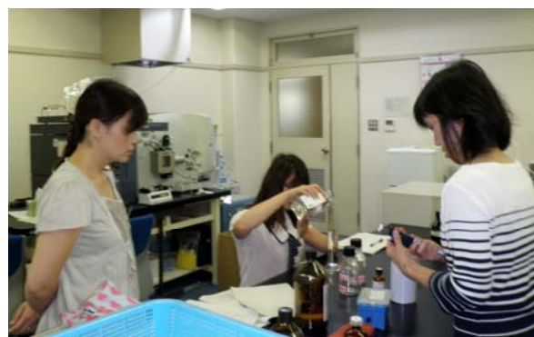
図 1 試薬調製の様子