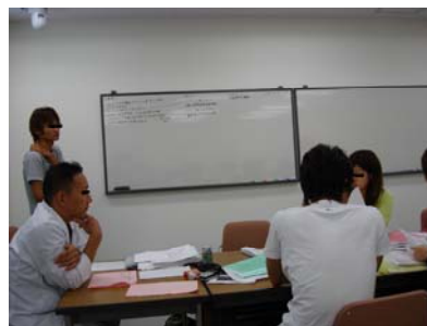
PBL チュートリアルの状況

2007年度に関して言うと、班の課題は「担当フィールドについて、そのフィールドの特徴を新しい指標を用いて表し、試験の日にプレゼンテーションすること」であった。個人の課題は、「街路空間の断面図と平面図を作成して試験の日に展示すること」であった。学生達は(実習室は24時間自由に使えるので、)授業時間以外に個人課題・グループ課題を進め、試験(ジュリーと呼ばれていた)での発表に備えていた。測定用の巻き尺等は貸与され、隣室のコンピューター室も自由に使える状態になっていた。我々はこの春の演習を2006年度および2007年度と2年連続してビデオ撮影し、ビデオセッションに授業担当教員の参加を得ながら、やはり数十時間をかけて分析を行った。