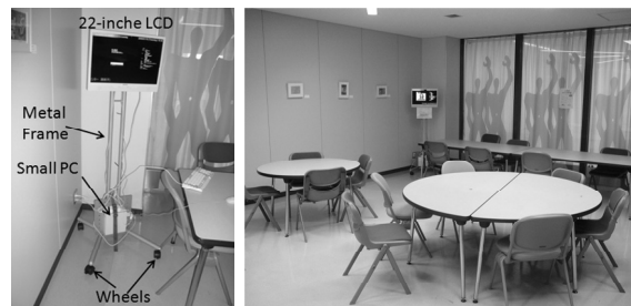
Fig. 3 Niche-Learning system on public space in university building

コンテンツを作成する学生コンテンツクリエイター (以下, 学生 CC と記す) を募集し, 3 名の学生 (メディアアートに興味を持つ学部生) を u ラーニングセンターの予算でアルバイトとして採用した.