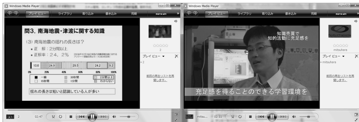
(a) Quiz slideshow (video) about disaster prevention

これまでの運用を振り返ると、プロジェクト専属メンバーではない教職員 2 名がプロジェクトを円滑に運用するのは難しいと言える。例えば、2008 年 1 月に試作システムが完成して同年 4 月に配信を開始する間、教員は学生指導や学会参加で多忙となり、プロジェクトに十分な時間を割けなかった。Niche-Learning プロジェクトは決