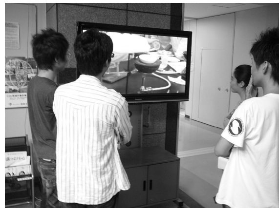
Fig. 4 Niche-Learning system on central entrance in university building