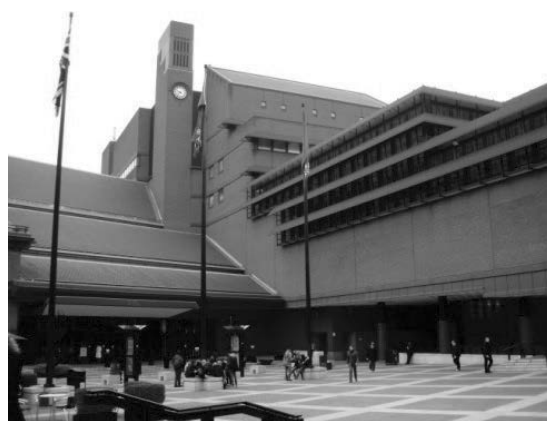
British Library 前の広場