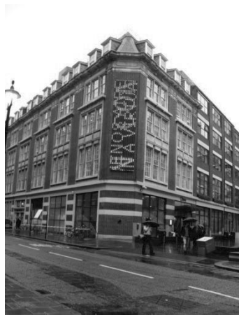
LSE Library のある建物

LSE 交流担当の Annette Haas 氏を介して許可を得ていたもので、案内はないものの入館、見学ができた。地下 1 階、地上 4 階。フロアは会話、携帯電話禁止の silent zone、静かな会話ならよい quiet zone、グループ学習の場にゾーンわけされている。食事禁止、飲み物はこぼれないものは可。ワークステーションが設置された机が地下～3 階まで多数ある。地下だけでも 200 席以上あった。そのほか電源、ネットワーク接続できる机があり利用者は持ち込みのパソコンを使って学習している。雨と試験前のためかワークステーションやパソコンが利用できる机には空きがないほどの混みようである。端末に向かって学習する学生たちの螺旋階段からの眺めは壮観であった。