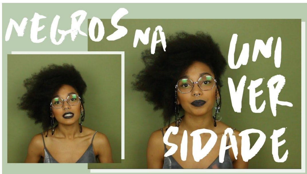
Imagem 3 - Negros na universidade - racismo institucional, epistemicídio e violências simbólicas

10