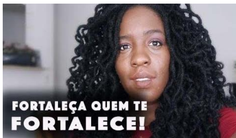
Imagem 8 - Capa do vídeo Uma conversinha franca e necessária