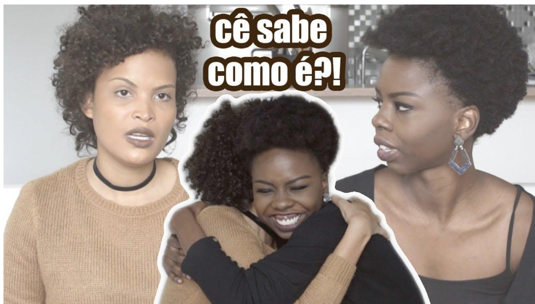
Imagem 6 - Capa do vídeo Maioria branca, ascensão e pele clara ft. De Mudança