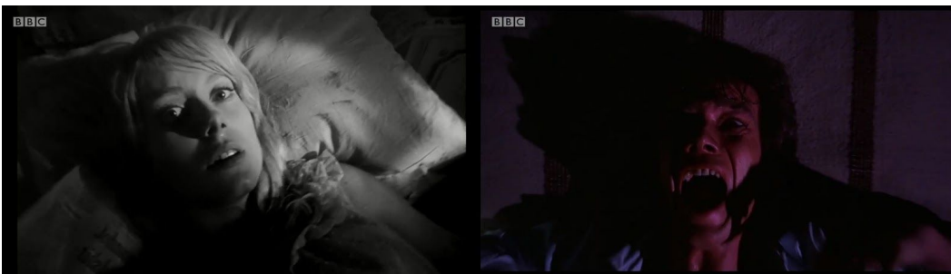
Figura 02 - Montagem musical em Fear Itself

Em determinada parte de Fear Itself , a narradora concebida por Lyne fala sobre sentir-se imbuída de medo. Em seguida, há uma montagem 16 (Fig. 02) que inclui cenas do filme Repulsion (1965). Também há uma câmera alta que se aproxima e se distancia de um homem aterrorizado em Amityville II: The Possession (1982). As imagens e uma composição original de Jeremy Warmesley (da banda Summer Camp) se complementam: