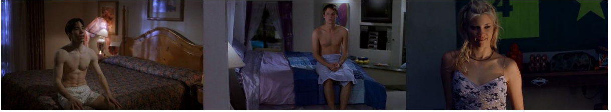
Figura 01 - Montagem musical em Beyond Clueless