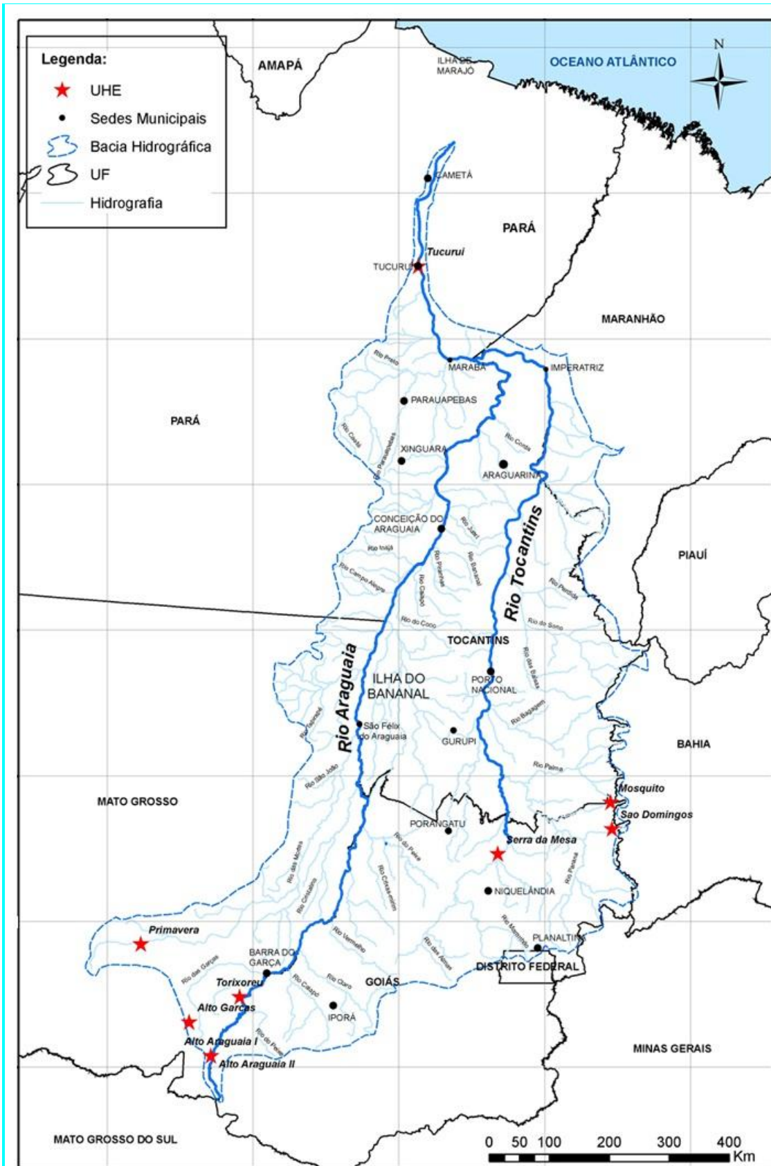
Figura 03: Bacia Hidrográfica do Tocantins-Araguaia