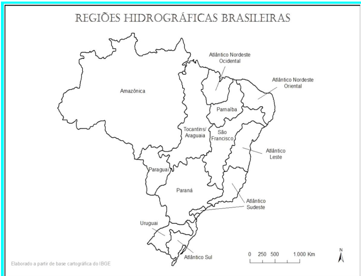
Figura 02: Bacias Hidrográficas do Brasil.