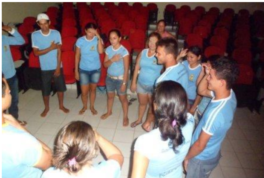
Construindo uma história