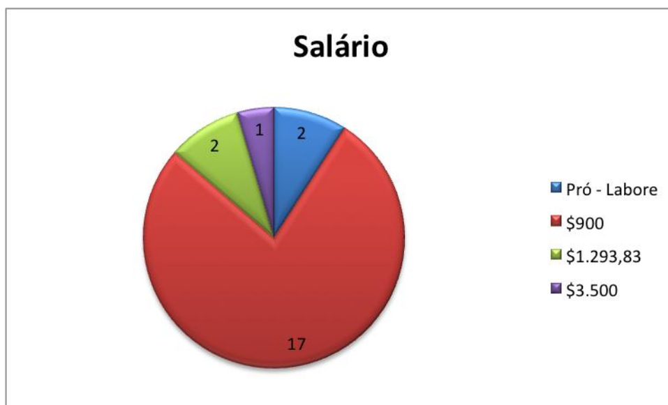
Figura 5 – Fonte Própria. Dados da Empresa – Piso Salarial.

E por ultimo, como dado pertinente da empresa, a figura 5 revela a classificação dos trabalhadores no que se refere ao piso salarial, tendo predominantemente, a valor destinado aos colaboradores da produção por serem maioria na empresa.