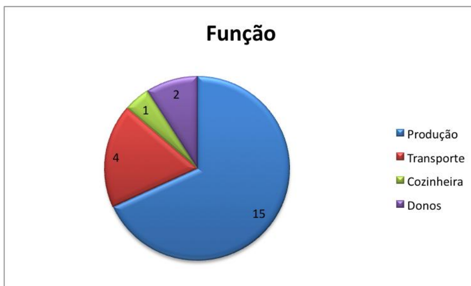
Figura 3 Dados da Empresa - Função

Ao se acompanhar e observar a empresa, um dos pontos levantados foi no que se refere à escolaridade dos funcionários. A figura 4 apresenta o nível de escolaridade da empresa. Pode-se notar que em sua maioria os trabalhadores não possuem o ensino médio completo. Tal fator pode ser consequente do ramo de trabalho não necessitar de nível escolar para atuar.