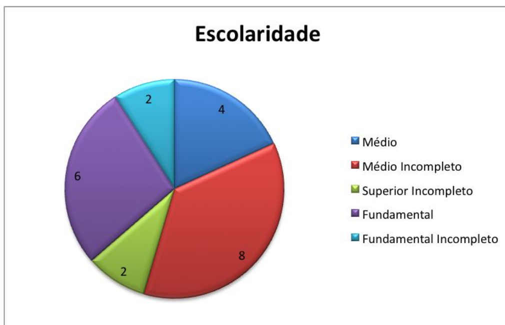
Figura 4 – Fonte própria, dados da Empresa – Escolaridade.

Ao se acompanhar e observar a empresa, um dos pontos levantados foi no que se refere à escolaridade dos funcionários. A figura 4 apresenta o nível de escolaridade da empresa. Pode-se notar que em sua maioria os trabalhadores não possuem o ensino médio completo. Tal fator pode ser consequente do ramo de trabalho não necessitar de nível escolar para atuar.