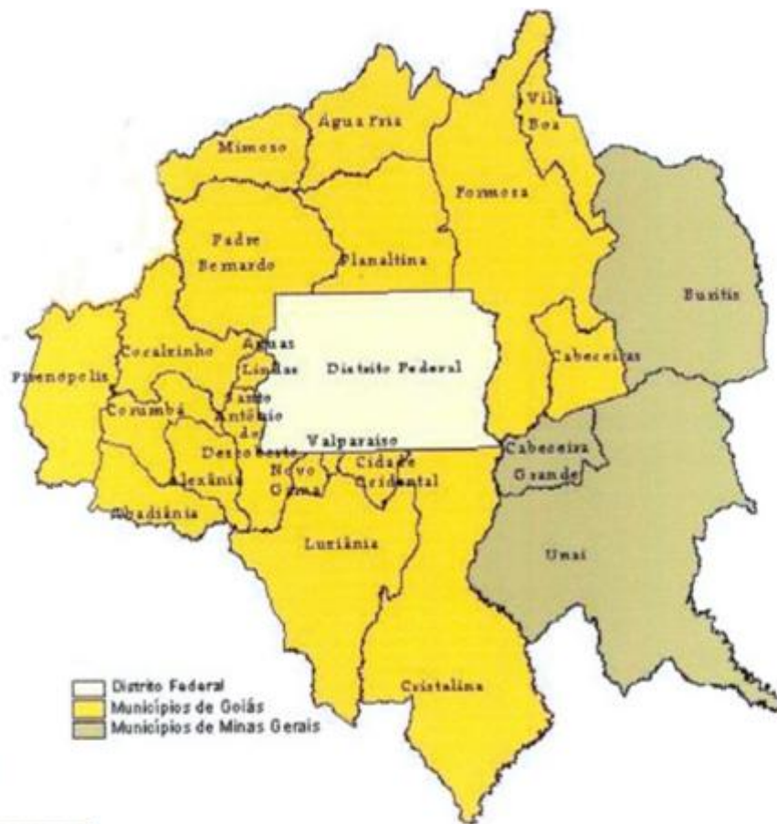
FIGURA I – Região Integrada de Desenvolvimento do Distrito Federal e Entorno – RIDE – 2007. (CODEPLAN, 2010)

Entender a presença dos vizinhos mineiros e goianos, além de ser fundamental para a compreensão do Distrito Federal, pode ser a estratégia comercial que ainda não foi lançada por nenhuma emissora local. São regiões distantes das capitais de seus estados, Goiânia e Belo Horizonte, desprovidas dos serviços estaduais e que buscam no Distrito Federal, trabalho, estudo, saúde, comércio e entretenimento. Estão diretamente ligados à rotina brasiliense e se sentem pertencentes a essa capital.