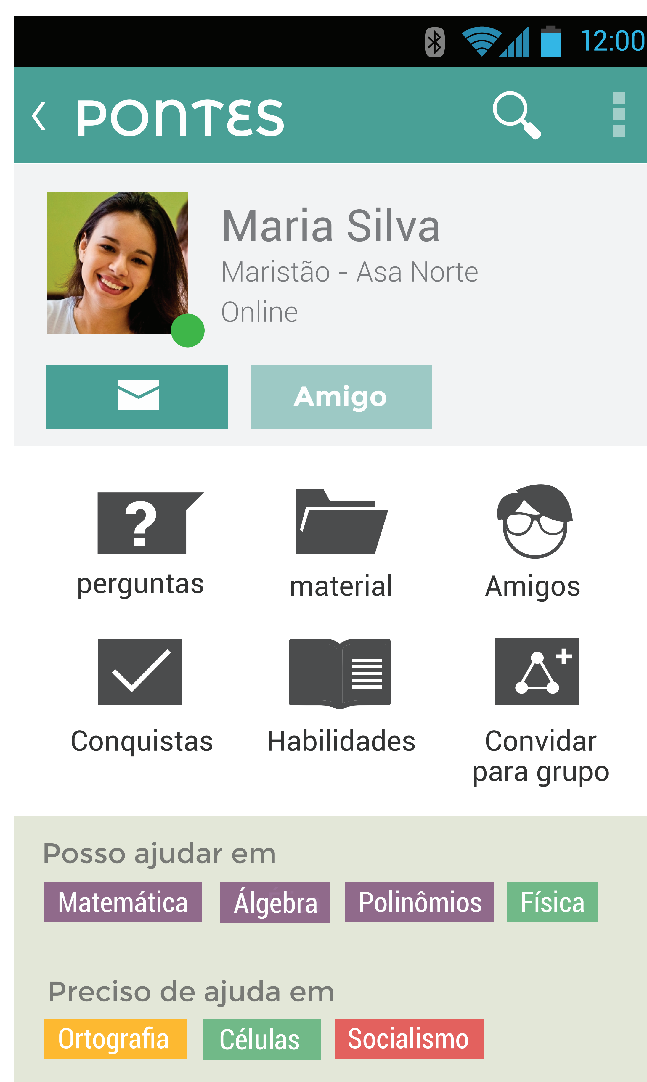
Figura 3 - Perfil de aluno