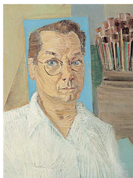
Auto-retrato , 1957. Fonte: Acervo Digital do Projeto Portinari. Cultural Pinakothek, Rio de Janeiro, RJ.

Arte brasileira só haverá quando os nossos artistas abandonarem completamente as tradições inúteis e se entregarem com toda alma, à interpretação sincera do nosso meio. Cândido (Portinari, 2003. p. 26).