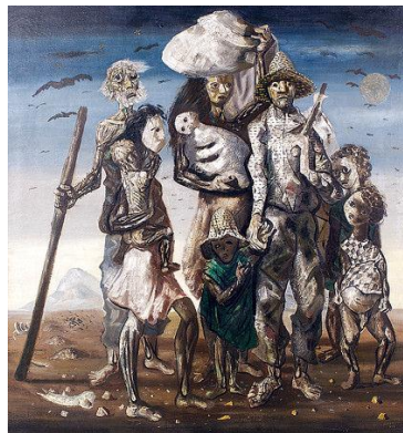
Retirantes (1944) Cândido Portinari - Óleo s/ Tela. 190 x 180 cm - Museu de Arte de São Paulo Assis Chateaubriand.

A série Retirantes, por exemplo, foi inspirada nas visões de Portinari, da sua infância. Quando ainda menino presenciou as mazelas dos retirantes em busca de sustento e dignidade.