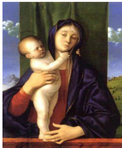
FIGURA 09 FIGURA 10 A Virgem com o Menino, Abraçando a Mãe Giovanni Bellini. Óleo s/ madeira, 75 x 59 cm Veneza