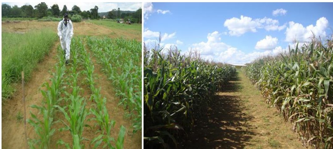
Figura 1. Tratos culturais e vista parcial das parcelas experimentais.

O solo da área experimental foi preparado por meio de gradagem e corrigido com calcário dolomítico, para atingir 60% de saturação por bases. Na adubação de plantio foi aplicado 350 kg/ha do fertilizante 04-30-16 na linha de plantio. Após 25 dias da germinação das sementes aplicou-se 100 kg/ha de nitrogênio na forma de ureia e, após 52 dias da germinação foi aplicado 250 kg/ha do fertilizante 20-05-20 em segunda cobertura. Aproximadamente três semanas após o plantio as parcelas foram pulverizadas com 2,5 l/ha do herbicida Gramaxone e, em seguida com 2,5 l/ha do herbicida Primestra na fase vegetativa V4 (folha desenvolvida). Ainda na fase vegetativa, as plantas foram pulverizadas com inseticida para o controle da lagarta do cartucho. Na Figura 1 pode ser observado o manejo de pulverização e a vista parcial das parcelas experimentais.