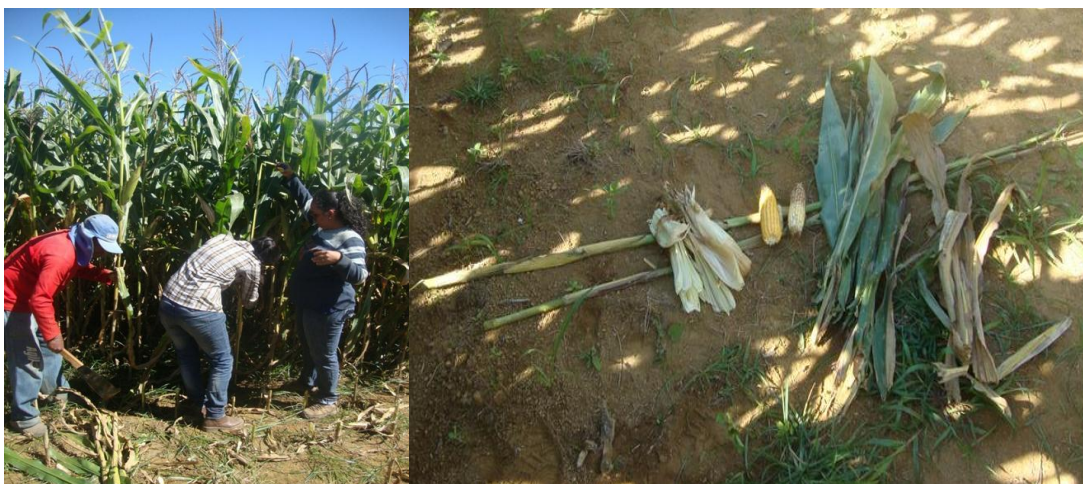
Figura 2. Avaliação da altura e parâmetros morfológicos.

restantes foram separados e pesados os componentes morfológicos: lâmina verde, lâmina seca, palha da espiga, haste e espiga (Figura 2). Posteriormente, o restante das plantas foi colhido manualmente e pesado para obtenção da massa total de matéria verde de silagem por hectare. Para obtenção da produção de matéria seca, o material colhido foi triturado, homogeneizado e três amostras de 500 g de cada parcela foram secadas em estufa de ventilação forçada a 60 °C durante 72 horas.